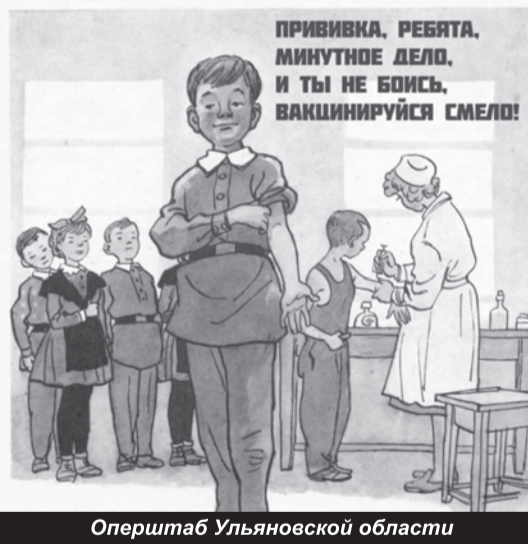
Оперштаб Ульяновской области

Что смущает людей во всем этом. Во-первых, ограничение их свобод. Многие понимают, что сегодня весьма оперативно законы начинают подгонять под ситуацию, не особо оглядываясь при этом на права человека, чтобы «развязать руки». Во-вторых, даже многие приверженцы вакцинации предпочитают подождать, поскольку вакцины не прошли надлежащего периода испытаний, этого никто не скрывает. В-третьих, отсутствие результатов порождает желание выдать желаемое за действительное, как это случилось, к примеру, со «Спутником»: сначала заявили о 90% его эффективности, а затем сознались, что потребуется ревакцинация. В инструкции же черным по белому указано, что он «зарегистрирован по процедуре регистрации препаратов, предназначенных для применения в условиях угрозы возникновения, возникновения и ликвидации чрезвычайных ситуаций». А сама «Инструкция подготовлена на основании ограниченного объема клинических данных... и будет дополняться по мере поступления новых». Само примене-