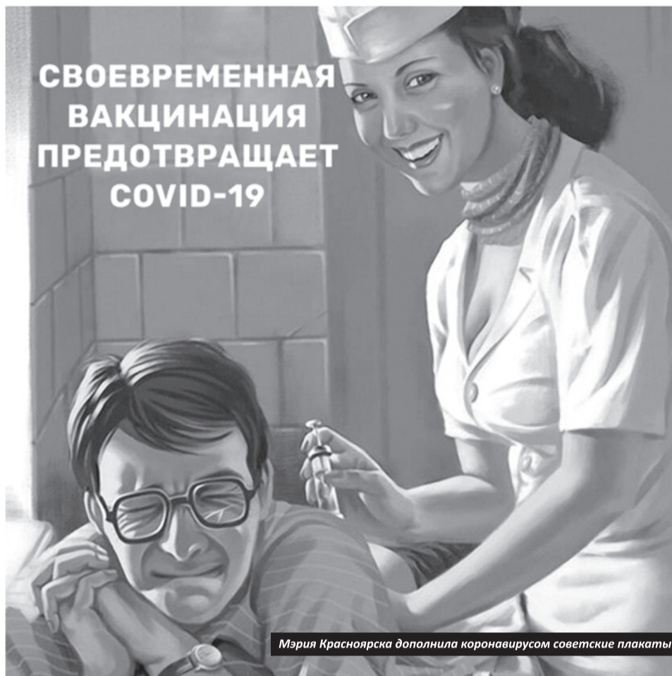
Мария Красноярска дополнила коронавирусом советские плакаты

Но больше всего людей беспокоит агрессивная реклама вакцинации и непонимание, кто руководит процессом? Если главный говорит о добровольности, то почему в реальности все наоборот? Почему первые лица присутствуют на массовых мероприятиях без масок, а всех остальных за это штрафуют? Почему в магазин нельзя, а на «Алые паруса» - можно?!