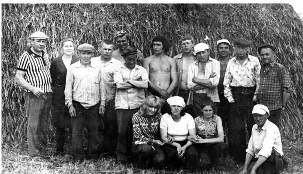
Рабочие МТМ на заготовке кормов

свиней. Для ведения хозяйства выращивали картофель, многолетние травы, корнеплоды, силосные, зерновые, овощи. С 1973 г. совхоз по решению Свердловского института перешел на воспроизводство нетелей.