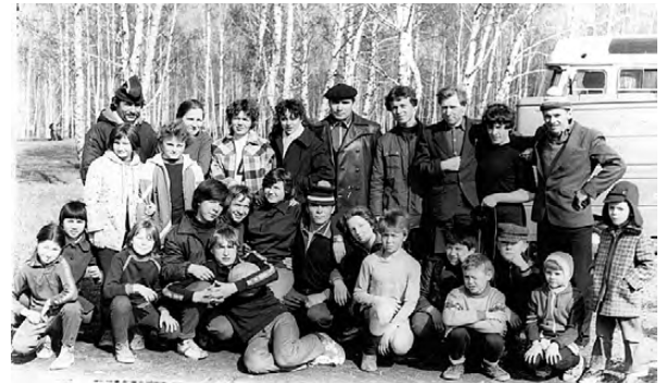
Молодежь на спортивном мероприятии