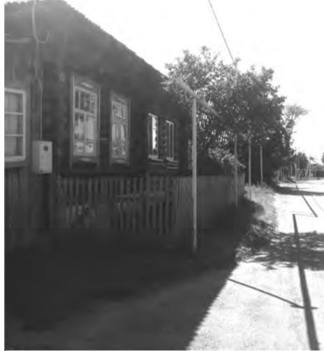
Талица, ул. Пролетарская. Газовая труба обрывается на половине улицы.

В границах земельных участков и в домовладениях все работы по созданию сети внутреннего газоснабжения и установке газоиспользующего оборудования останутся в зоне ответственности собствен-