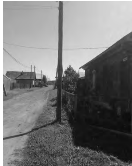
Талица. Перекресток улиц Пролетарская-Урицкого. Половина улицы Урицкого осталась без газа.

Сегодня можно наблюдать на некоторых городских улицах картину, когда прямо у ворот домов желтеют потрескавшейся, местами обвалившейся краской невысокие металлические ограждения, за которыми торчат газовые трубы. Но эти несколько метров, по-видимому, для многих непреодолимы из-за выставленных непомерных счетов за подключение. Хотелось бы, чтобы