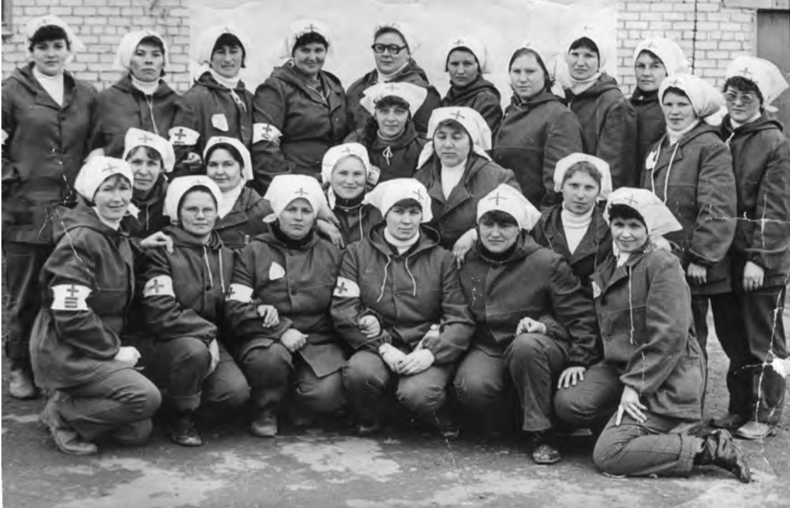
1986 г. Санитарная дружина совхоза «Талицкий».

Фото можно принести в редакцию, а также отправить по электронной почте: gazeta-sn@mail.ru