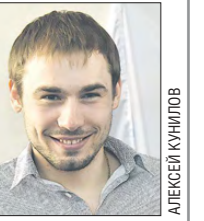
Антон Шипулин, будущий депутат Серовского избирательного округа

Антон ШИПУЛИН, победитель довыборов в Госдуму (за него проголосовало 45,9 тысячи избирателей — 42%)