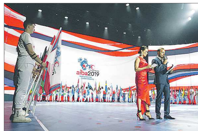
Парад флагов стран-участниц чемпионата мира по боксу в Екатеринбурге

Также 14 сентября зрители смогут увидеть в деле ка-