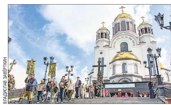
Симоновский крестный ход проходит по маршруту: Екатеринбург — Верхняя Пышма — Балтым — Магистровское — Колташи — Октябрьское (Шайтанское) — Липовское — Глинское — Девево — Арамашево — Коптелово — Алапаевск — станция Межная — Верхняя Синячиха — Бубчиково — Мугайское — Махнёво — Меркушино — Усть-Салда — Костылево — Красногорское — Верхотурье