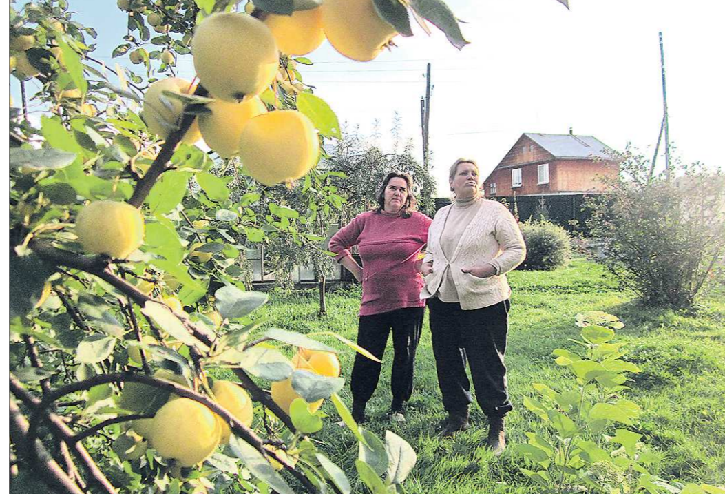
Чтобы не иметь проблем с законом, излишки яблок лучше не отдавать в школы, а хранить их в погребе или перерабатывать впрок

Поэтому закупкой продуктов для детского питания занимаются специальные операторы, которые работают с проверенными поставщиками. Они имеют все необходимые санитарные документы на свою продукцию и сами отвечают за её безопасность. Но часто бывает так, что дети приносят в школу мешок яблок и