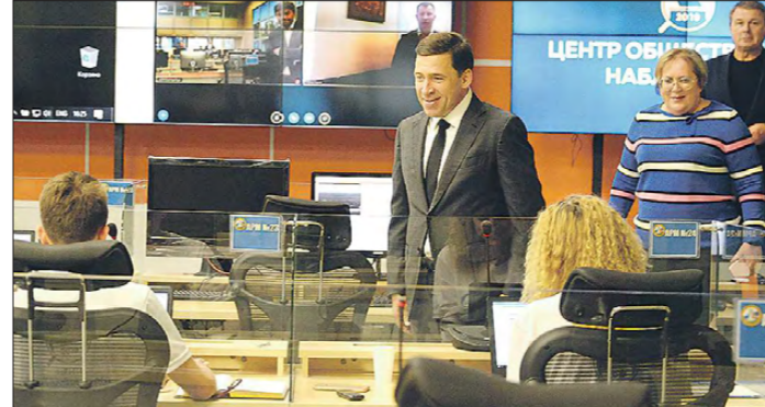
Площадку Центра общественного наблюдения в Екатеринбурге по традиции посетил губернатор Евгений Куйвашев