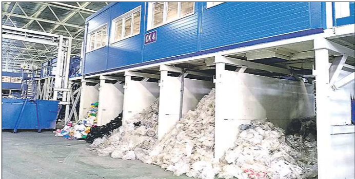
Плёнка – один из самых ходовых товаров. На тюменском заводе её сортируют по качеству и цвету