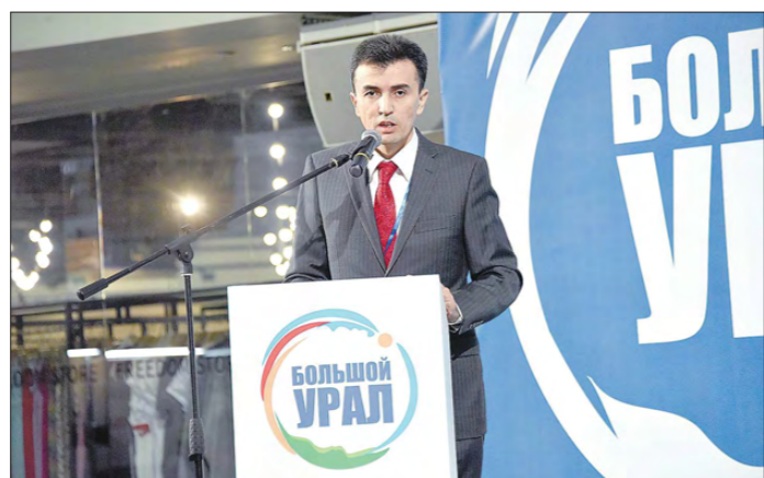
Выступая на открытии Международного туристского форума «Большой Урал - 2019», Абдусалом Хатамов отметил вклад Свердловской области в создание туристических объектов на территории региона

Мы рассчитываем, что Узбекистан станет одним из самых привлекательных направлений для зимних поездок уральцев. Этому способ-