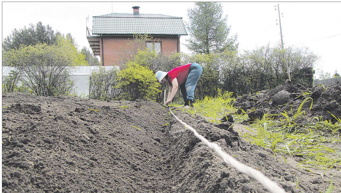
Главное при посеве овощей на грядку – создать посевной слой: разрыхлить хорошенько почву, в которую лягут семена

Если вы приверженец органического удобрения, то вместо минеральных можно использовать древесную золу – 300–500 граммов на квадратный метр. Обязательно нужен перегной, но ни в коем случае не навоз. Для моркови лучше, если органиче-