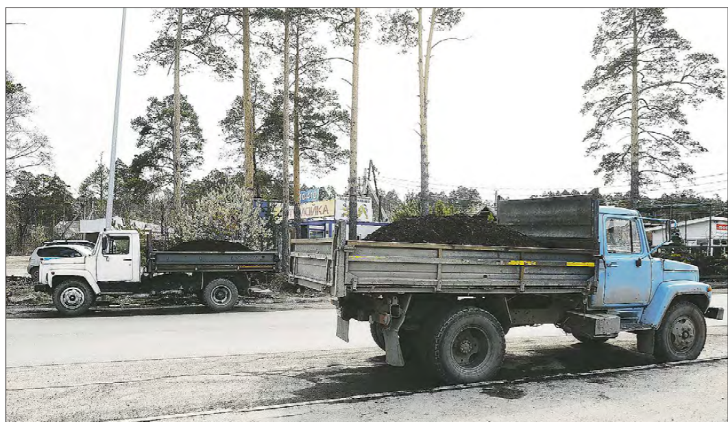
Покупая машины с чернозёмом и землёй на обочинах дорог, вы рискуете занести на участок болезни растений и вредителей