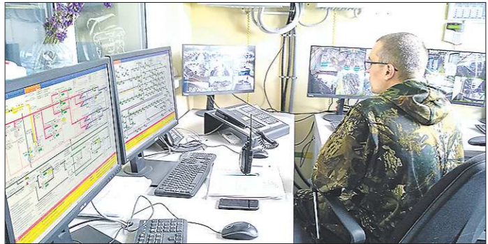
Оператор завода в Тюмени следит за работой всех производственных линий и в случае необходимости удаленно устанавливает конвейер