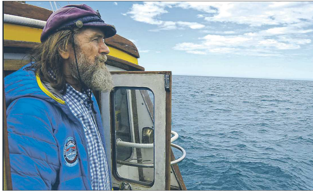
Федор Конохов: «Пересечь океан - большое событие, но, чтобы безопасно завершить переход, потребуются все силы и концентрация»

За то время, пока мы рассказывали об этом путешествии Федора Конохова, многие читатели спрашивали - «Зачем Федору так рисковать жизнью, во имя чего? Думаем, лучше нечего самого на этот вопрос не ответит никто. Федор опубликовал рассуждение об этом в сво-