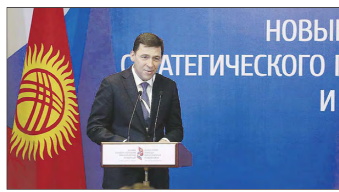
Евгений Куйвашев, выступая на форуме, рассказал о взаимодействии региона и Кыргызстана