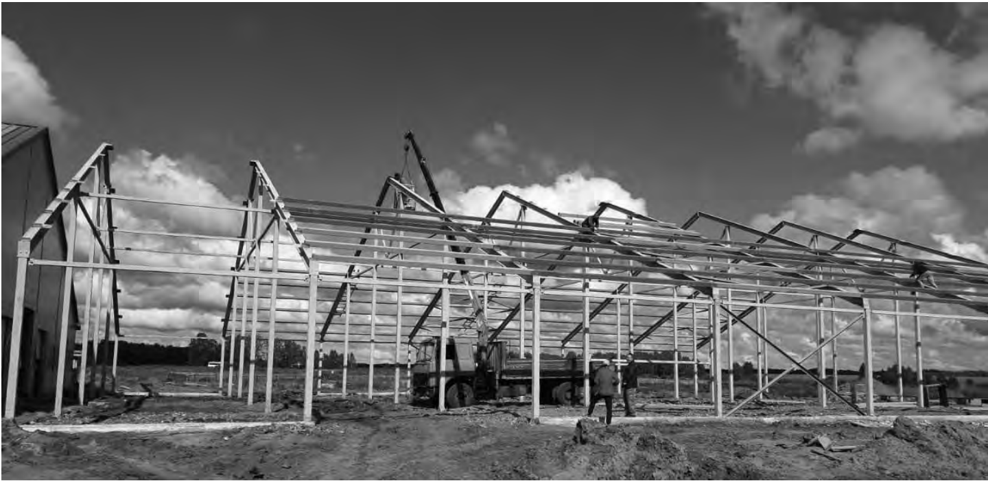
Новый комплекс СПК «Заря»