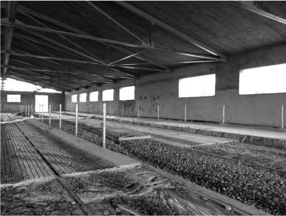
Ферма-робот в д. Черемуховой почти готова

и рассчитана на 80 коров. Строительство идёт полным ходом, к зиме объект должен быть сдан в эксплуатацию.