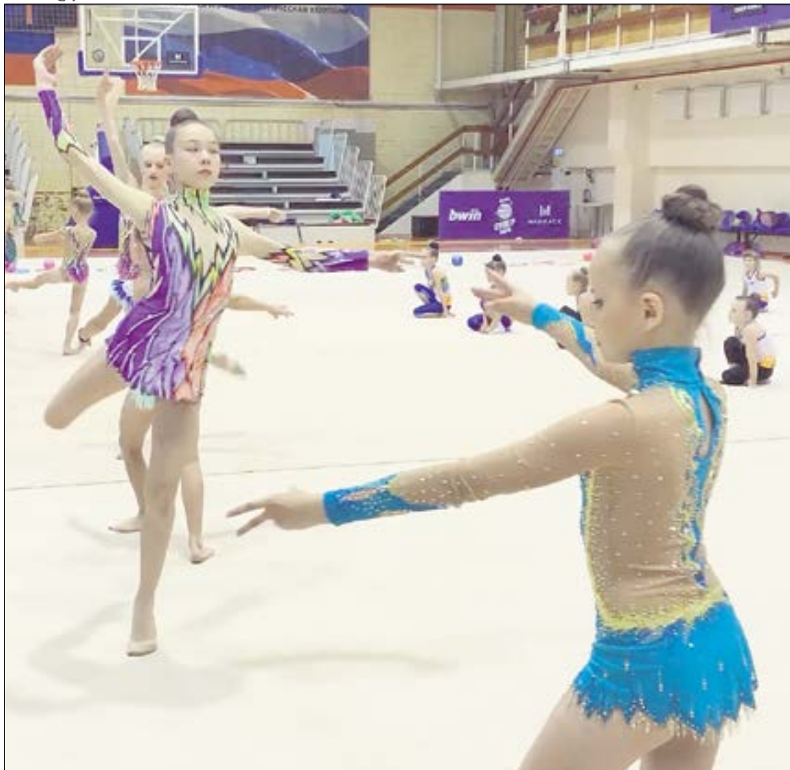
На сборы в Ревду приехали 30 девочек от 3 до 12 лет..