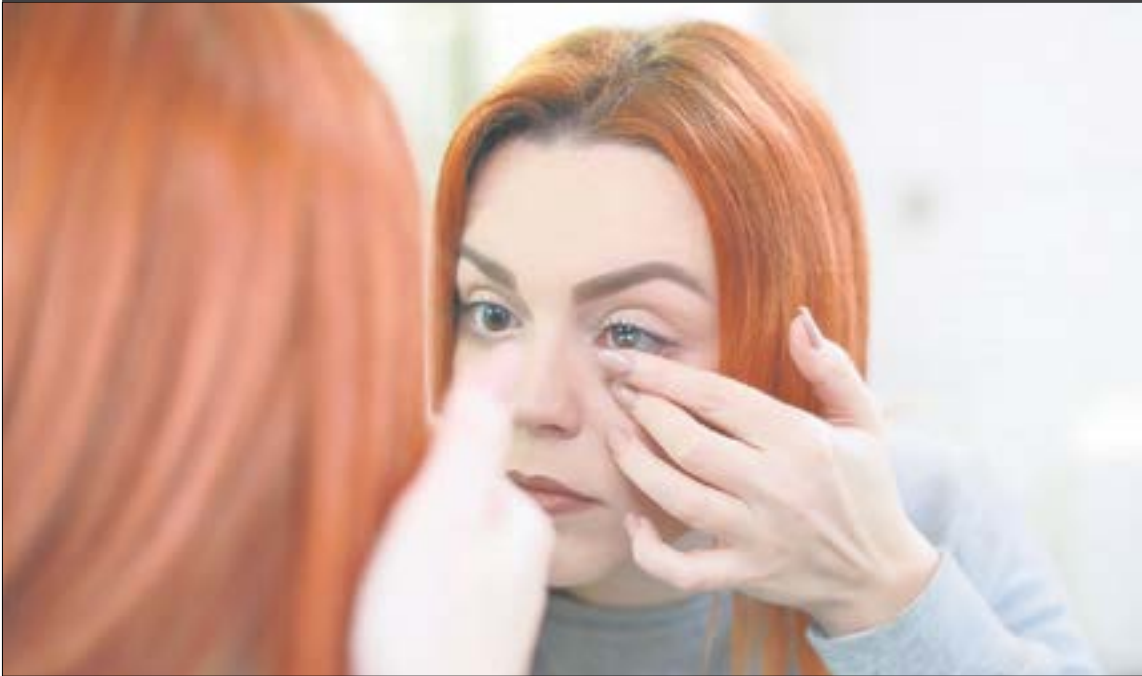
Особенно внимательно нужно следить за своими привычками тем, кто носит контактные линзы. • Фото pixaby.com