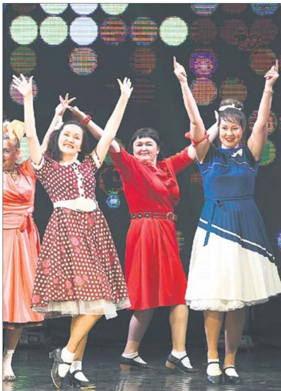
Коллектив девчат станцевал под попури из хитов разных лет.