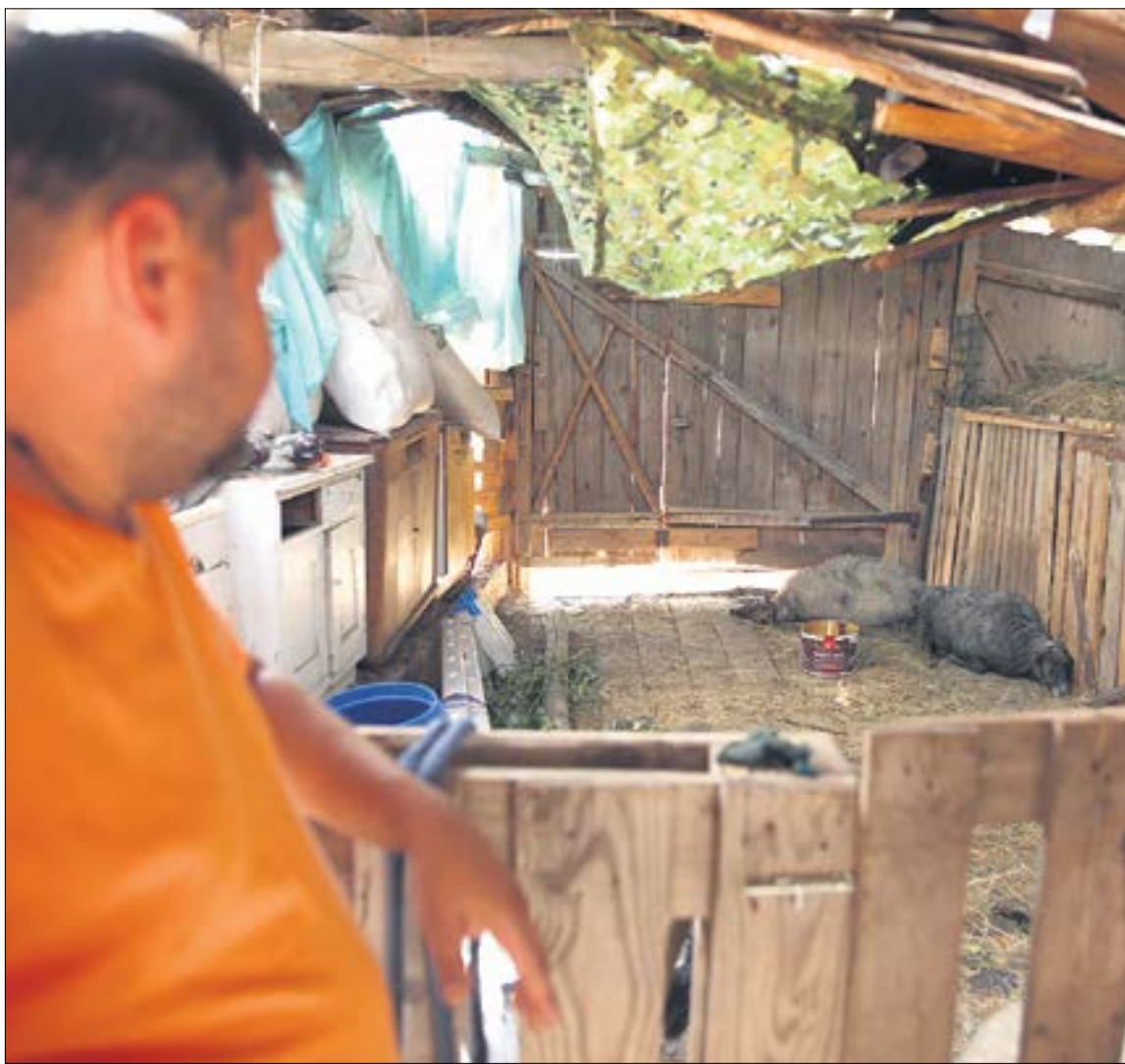
Погибшую овцу звали Яни. У ее дочери Чернушки перебита ахилла. Барану Барику прокусили нос. Ветеринары сказали, что пострадали все овцы. Сейчас животные лежат, им больно.

Врачи осмотрели покалеченных животных. У всех овечек шок, но одна пострадала особенно сильно. Сначала думали сделать ей кесарево, но решили подождать один день. Хотя, к чему медлили? У нее диагностировали внутреннее кровотечение в районе шеи и перелом правого предплечья. Остальные животные отделались небольшими травмами, а барану Барику прокусили нос.