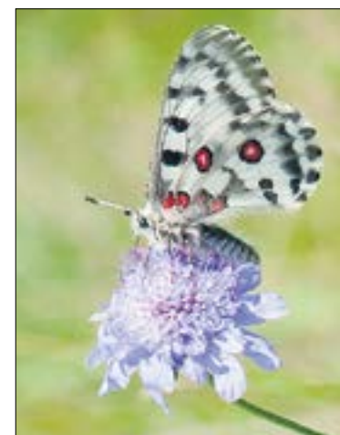
Бабочка-аполлон, занесённая в областную Красную книгу.

дорога в село Мариинск через Кислянку. Сейчас эта дорога сильно заросла. Но раньше, в XIX веке, она была основной и её использовали постоянно для перевозки чугуна из Ревдинского завода в Мариинский передельный завод. Обратно по ней везли листовое железо.