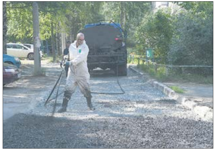
Во дворе дома №47 по улице Цветников щебеночное основание готовили к укладке асфальта с помощью битумной эмульсии.

Еще один тротуар появится на улице Некрасова. К нему компания еще не приступала, но готовится. Объем работ там гораздо больше, чем на улице Российской. И стоимость выше — 5 млн 984 рублей.