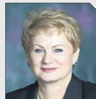
Светлана Учайкина, министр культуры Свердловской области:

— Общий бюджет мероприятий национально-го проекта «Культура» в Свердловской области с 2019 до 2024 года составит 1,7 миллиардов рублей. Из них 603,6 миллионов — средства федерального бюджета, 303,7 миллионов рублей планируется выделить из региональной казны, еще 164,7 — средства муниципальных бюджетов. Важно понимать, что 60 процентов населения Свердловской области — жители малых городов. Здесь учреждения культуры многофункциональны, призваны раскрывать творческий потенциал людей. Но в них самих должны быть созданы условия. Если в клубе холодно — дети в балетный кружок не пойдут. Поэтому материально-техническое обеспечение учреждений культуры — один из главных приоритетов. Мы с министерством строительства меняли методику расчёта в отношении учреждений культуры на селе. Задача — отремонтировать те, которые в этом нуждаются. Построить новые там, где они необходимы.