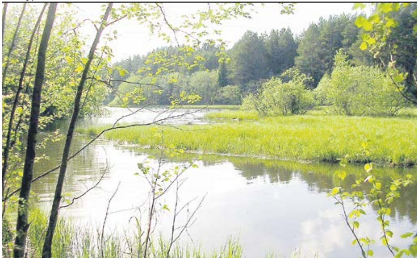
Устье реки Козырихи.