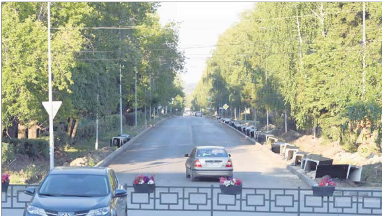
Компания СК СВ уже подготовила к укладке 44 лотка будущей ливневой канализации.

— Вероятно, такое впечатление создается, потому что мы начали устанавливать бордюры. На самом деле, от улицы Спортивной до улицы Цветников осталась ровно такая же ширина, как и была — 9 метров. Для дороги четвертой категории, к которой