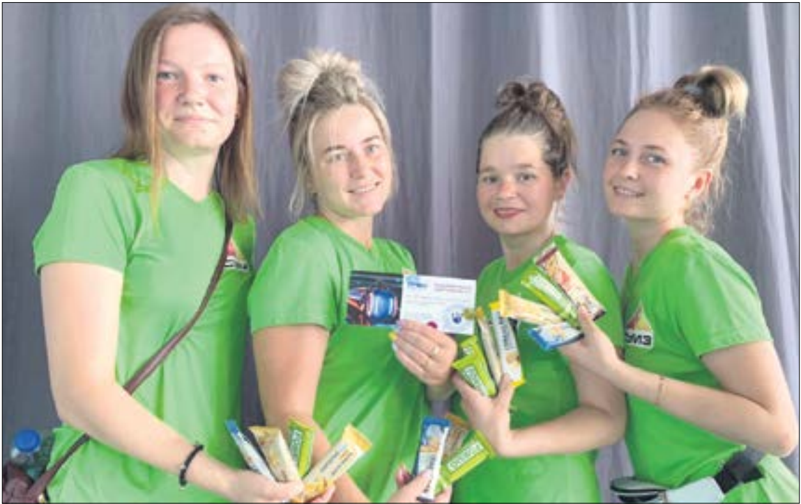
Девушки из управления контроля продукции назвали свою команду «Авокадо» и получили спецприз за оригинальное название.