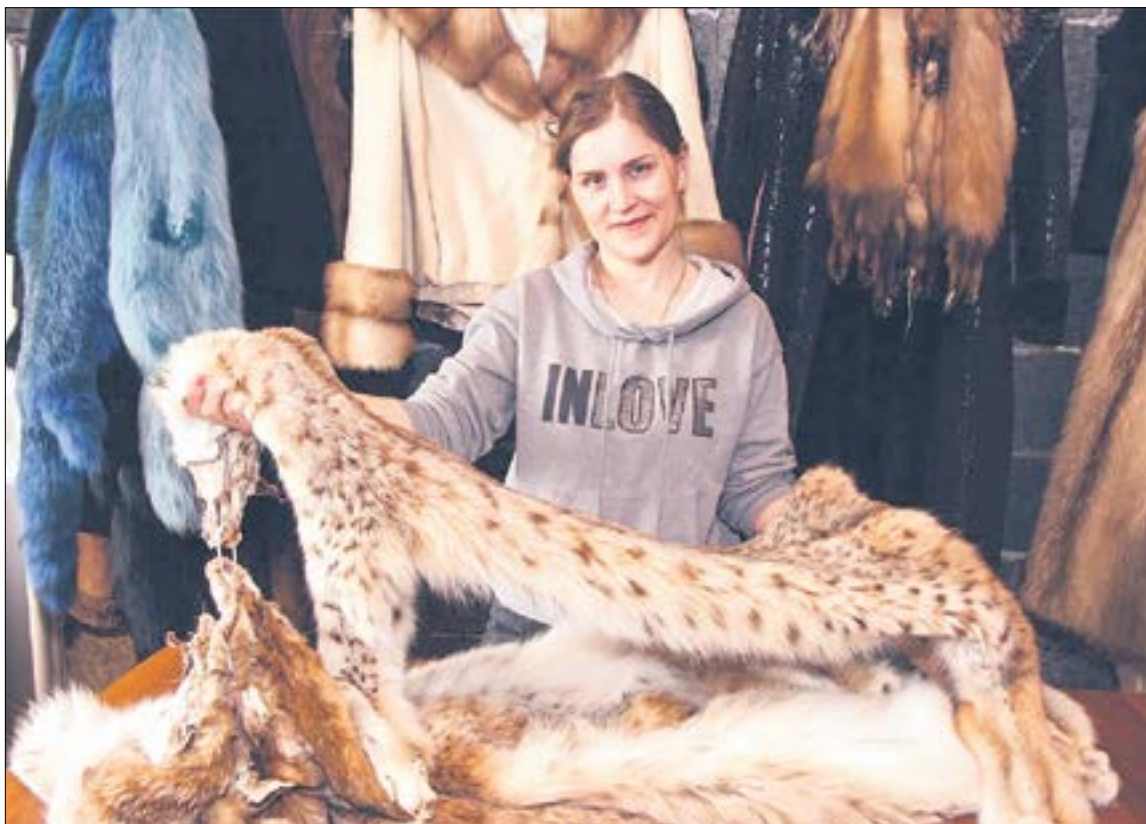
Мех рыси очень дорогой. И при этом не очень ноский.