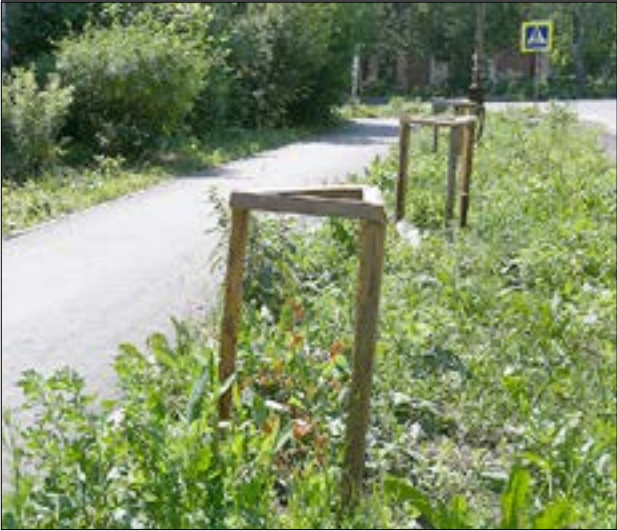
Вместо красивой аллеи в Больничном переулке пока стоят вот такие засохшие прутьи.