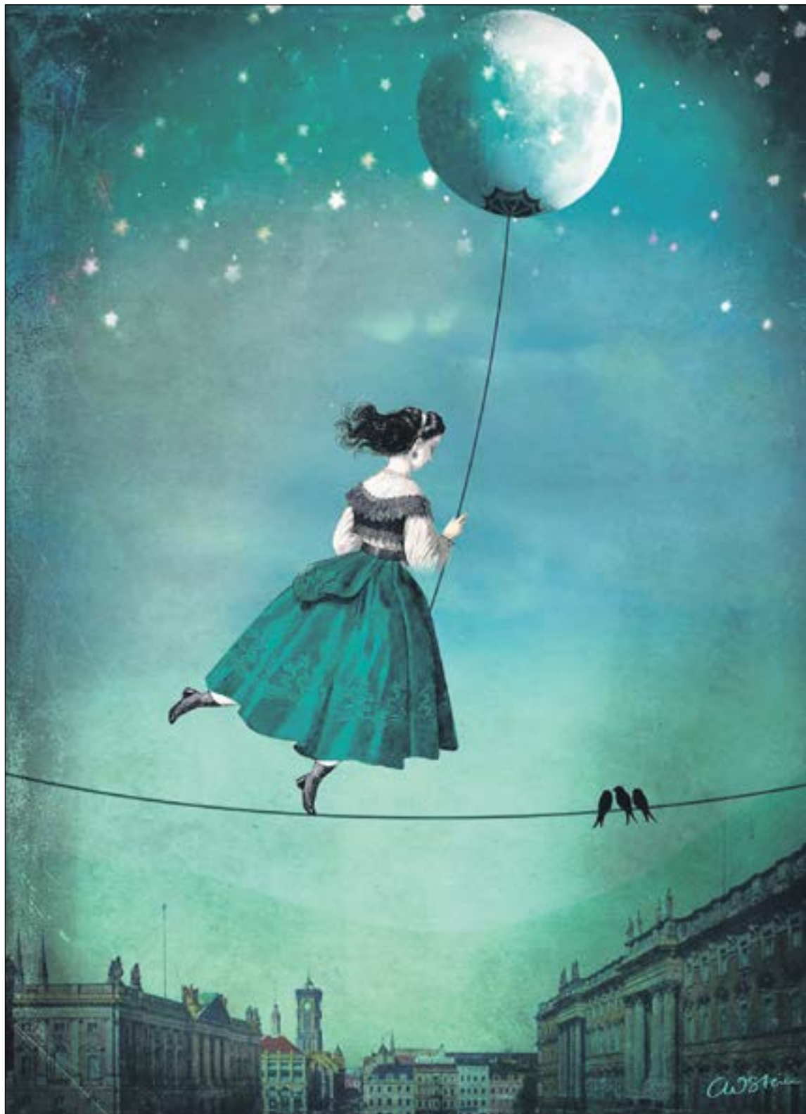
«Девочка и Луна» • Художник Катрин Вельц-Штайн (Германия)

Она ничего не решила. Колбасится до сих пор. Алик ждет. И никто не знает, что ждать гораздо проще, чем прожить день без вызова.