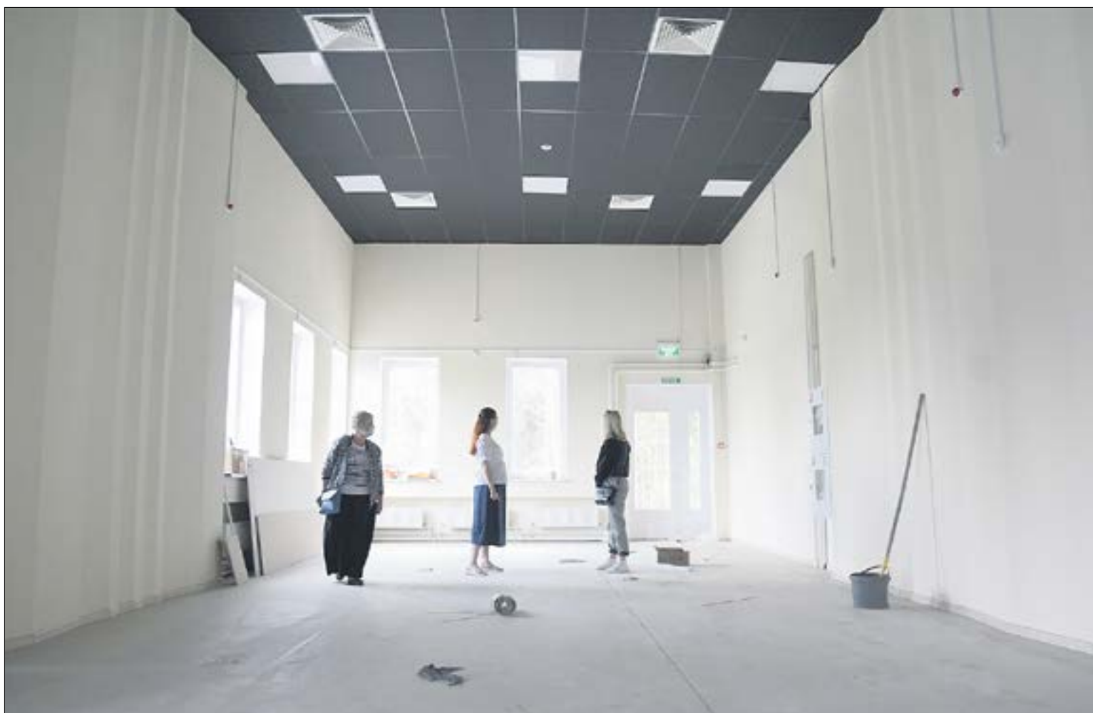
В зрительном зале осталось возвести сцену и поставить кресла. Их уже привезли. А у сцены установлен подъемник для маломобильных групп населения.