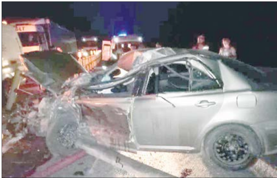
«Тойота Авенсис» пробила ограждение и попала под встречную фуру.

Напомним, что в следующем году областные власти обещают начать реконструкцию ревдинского участка трассы «Пермь-Екатеринбург» — его будут расширять до четырех полос, делать освещение и строить новые развязки.