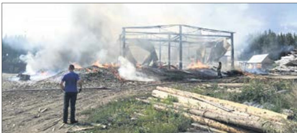
От здания пилорамы остался только металлический каркас.

Площадь пожара составила около 400 квадратных метров. Пострадавших нет.