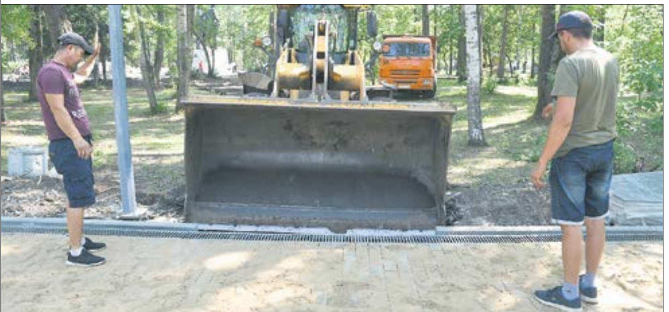
Рабочие готовятся прокладывать еще одну пешеходную дорожку, которая пойдет к центральной аллее.