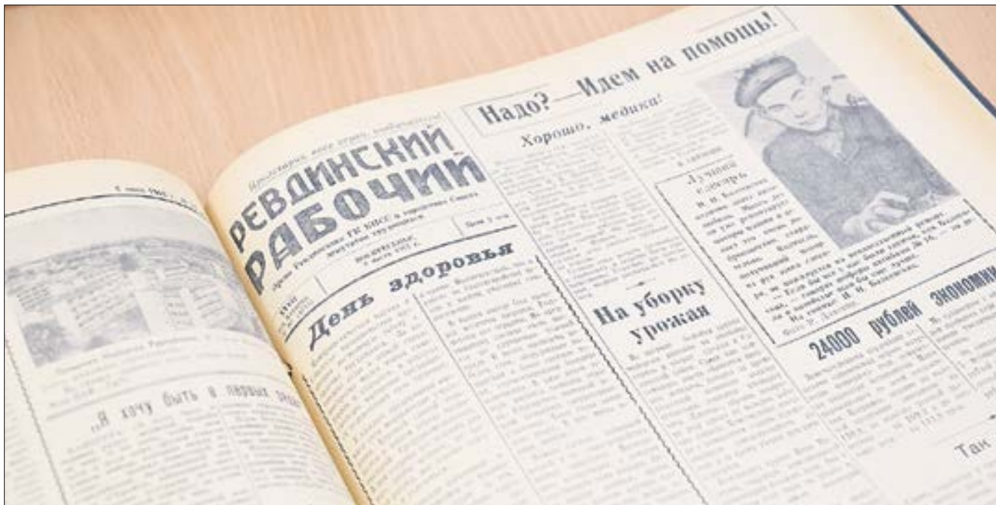
Всегда интересно читать о том, как в прошлом начиналось строительство того, что для нас сейчас является вполне привычным. Например, речь в одном из июльских номеров 1962 года идет о Новомариинском водохранилище, на месте которого тогда был лес. Ну и вообще, о бытовой жизни советских ревдинцев в старых газетах всегда много написано.