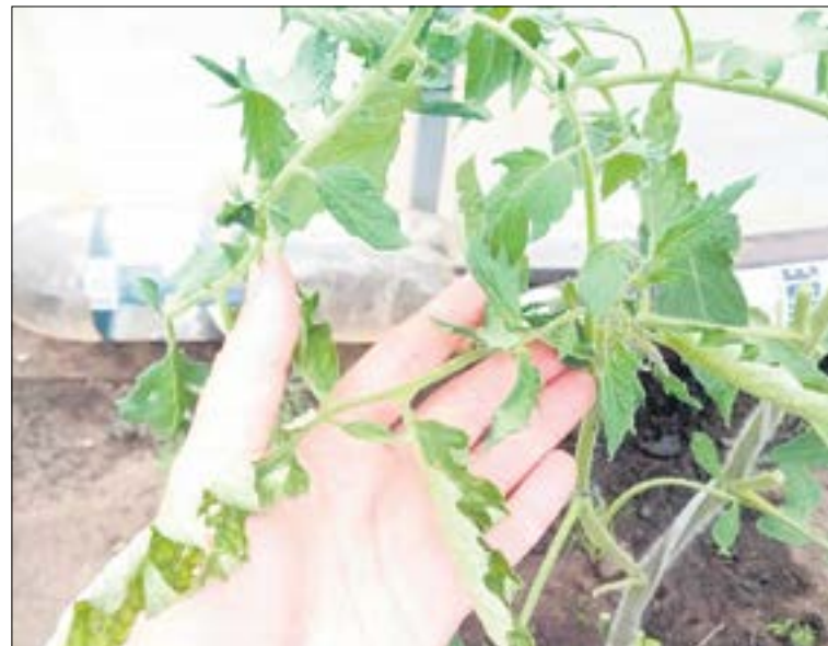
Скручивание листьев у томатов — сигнал тревоги. Нужно срочно искать и устранять причину.

Паутинный клещ плетет паутинку с нижней части листа. Для борьбы используют акарициды или чесночный настой.