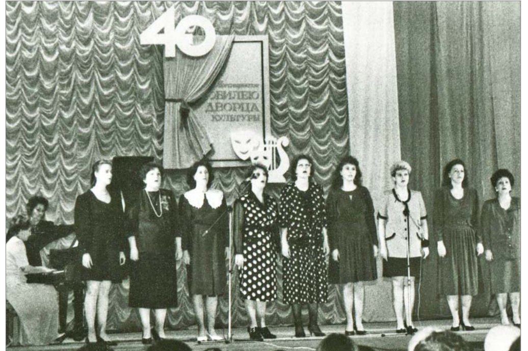
Хор педагогов детсадов – на концерте в честь 40-летия ДК.