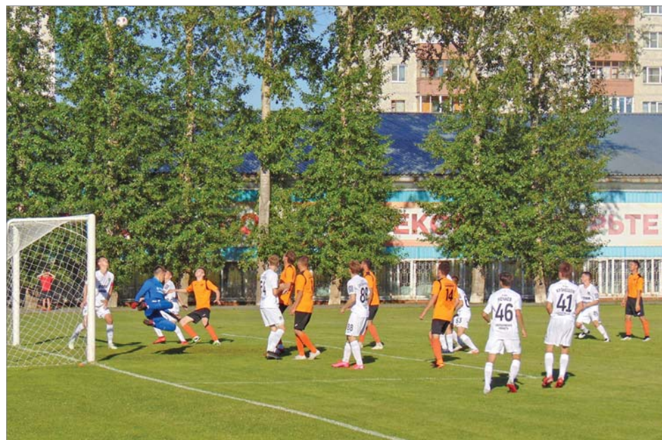
«Трюк» от голкипера «Урал-УрФА».