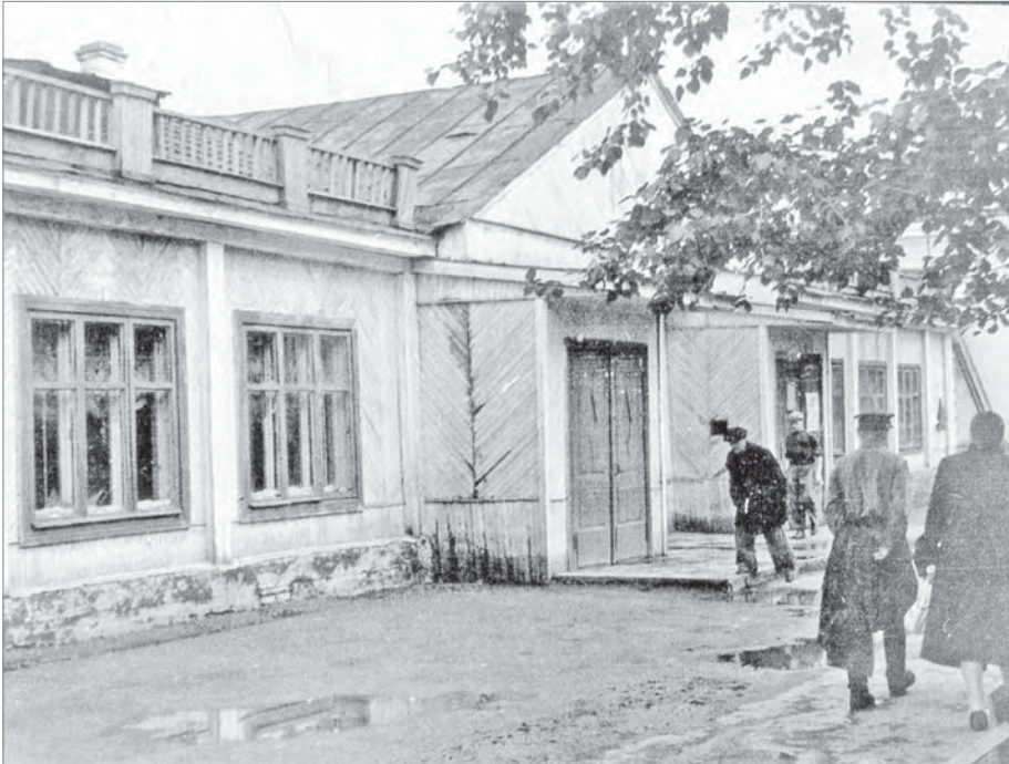
Старый клуб. Конец сороковых годов.