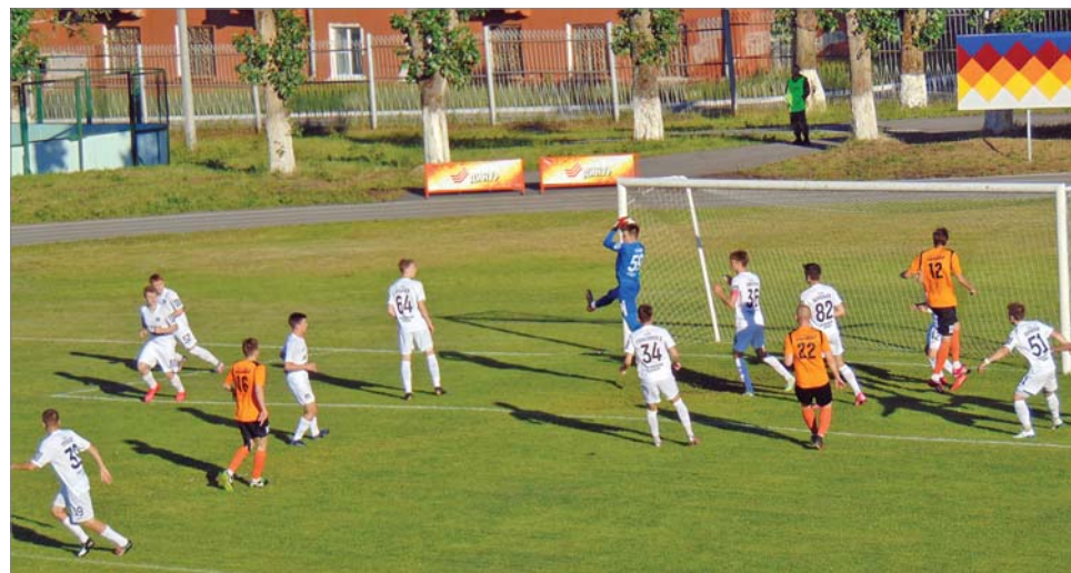
Красивое завершение атаки.