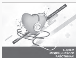
С ДНЕМ МЕДИЦИНСКОГО РАБОТНИКА!

Уважаемые медицинские работники Свердловской области и ветераны отрасли! Поздравляю вас с профессиональным праздником – Днем медицинского работника!