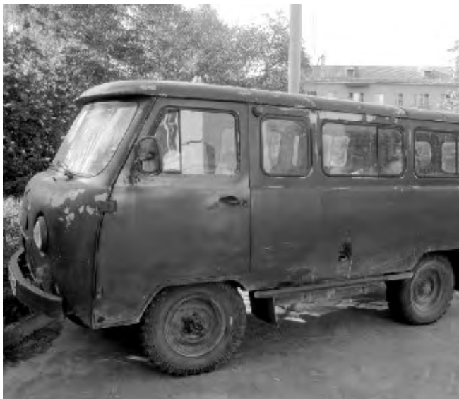
Старый УАЗик с дровами на Свердлова, 4