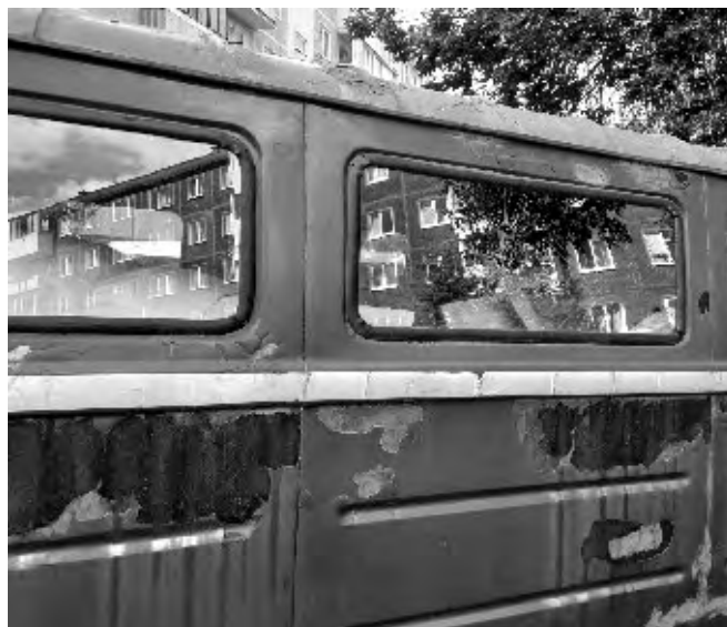
“Автокладовка” на Кузнецова, 5