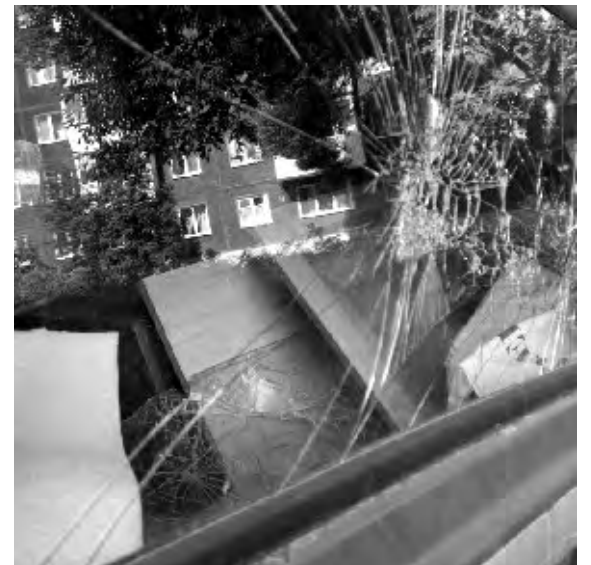
В ней хранят стройматериалы