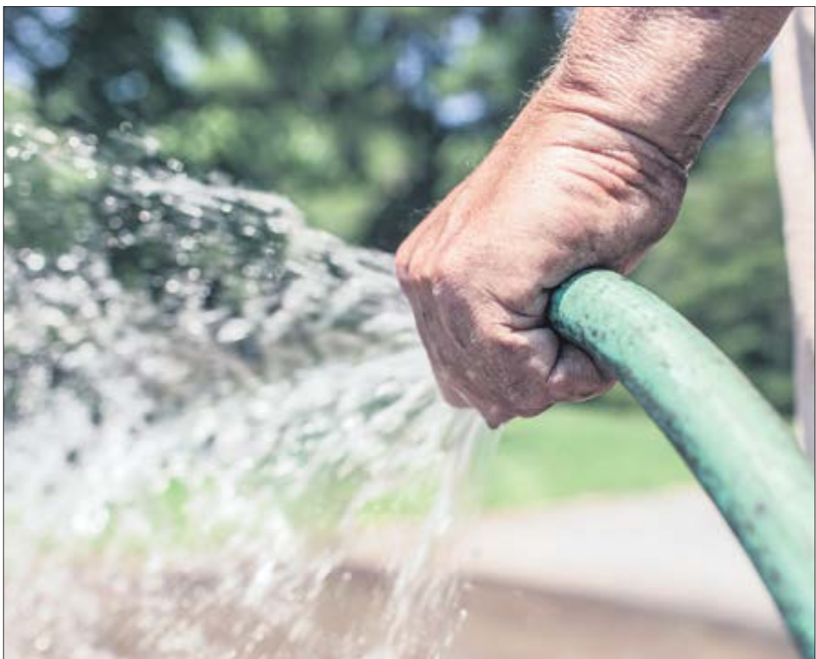
Поливая растения в жару, не нужно разбрызгивать воду! Лейте под корень, стараясь не мочить листья.

Подкармливать плодовые и ягодные культуры можно и так: прокопайте вокруг ствола небольшой обводной канал, заложите туда скошенную траву, золу из печи, немного торфа и навоза, все это полейте разведенным биологически активным препаратом для компостирования. Так растение получит не только питье, но и питание, которое сейчас нужно его корням.