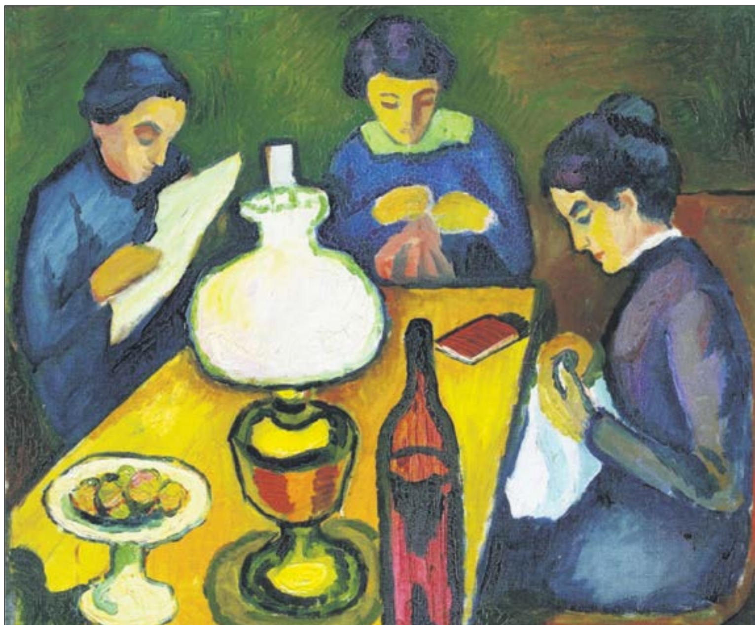
«Три женщины за столом с лампой» • Художник Аугуст Маке (Германия)

Когда они собираются за общим столом, ведут невинные диалоги о погоде, о коммуналке, о покупках и фильмах. А потом молчат. Молчат, и каждый ведет внутренний диалог. С самим собой. Диалог о живом.