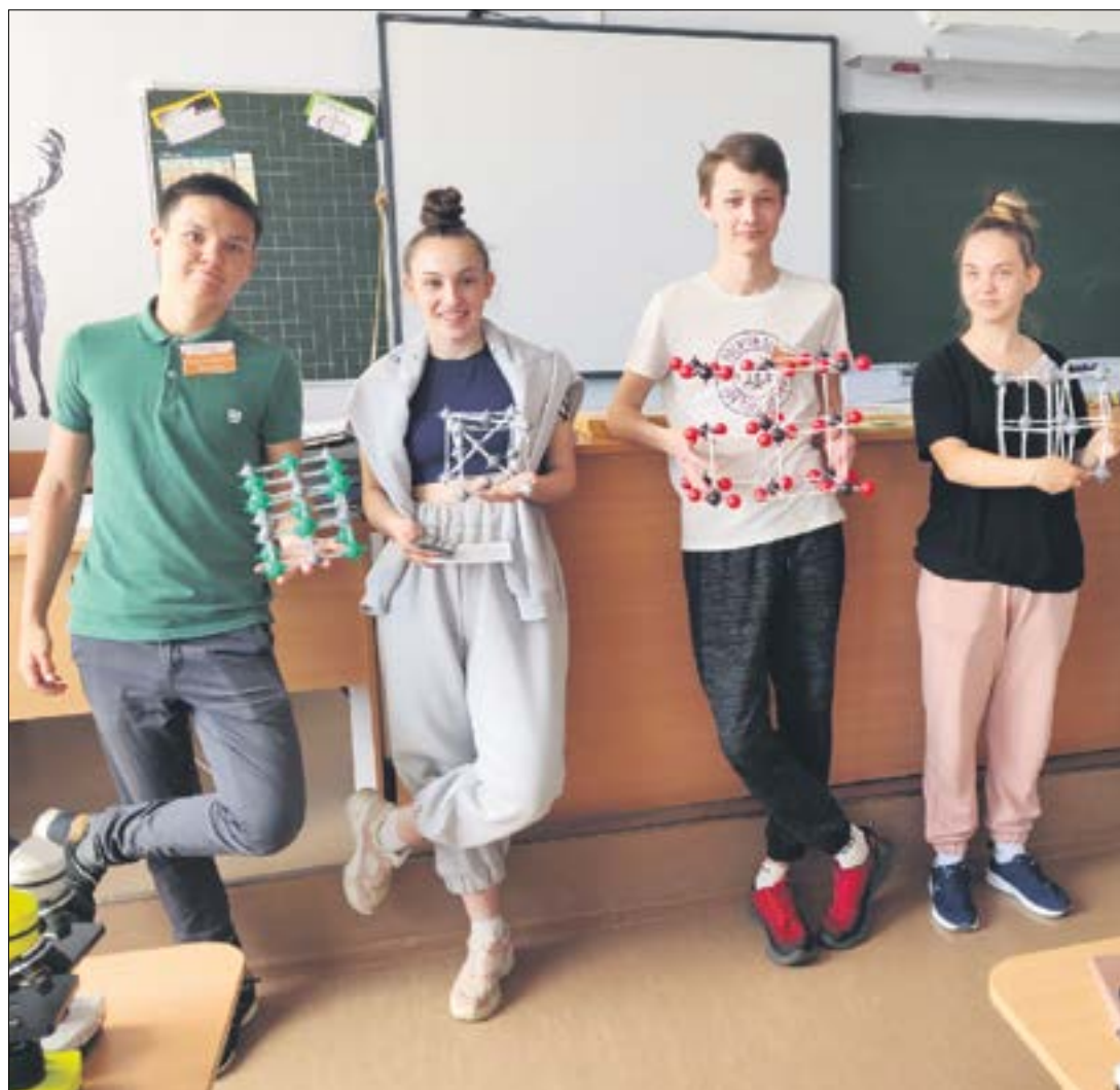
Даже стандартные школьные уроки на «Территории» проходят необычно. На химии, например, ребята собирали кристаллическую решетку химических элементов.

На «Территорию роста» приехали победители школьных олимпиад и активные участники разных конкурсов.