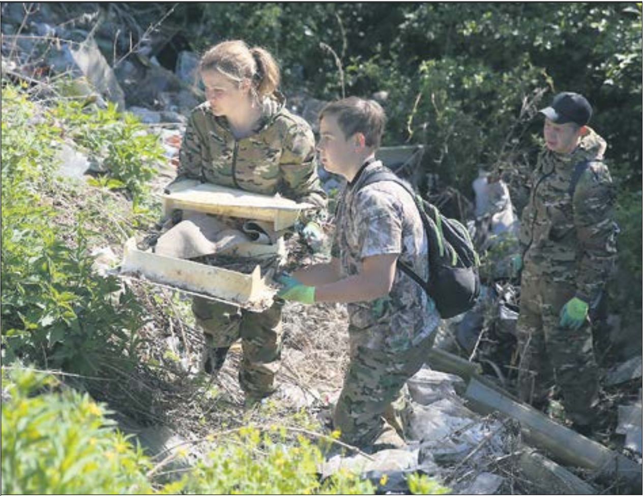
Массовые субботники проходят на Кабалинских родниках каждый год. Но несанкционированные свалки там появляются вновь. В основном, мусорят там садоводы. А убирают за ними — подростки.

Магазины часто строят там, где раньше были зеленые насаждения. Место, которое, например, очень нуждается в озеленении — вдоль тротуара, который ведет к большому «Магниту» по улице Павла Зыкина. Высаженные много лет назад там саженцы по недосмотру погибли. Почему бы не озеленить эту территорию еще раз, но уже относиться к молодым деревьям более бережно, чтобы они прижились?