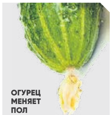
ОГУРЕЦ МЕНЯЕТ ПОЛ

■ в теплице и парнике в жаркие дни постоянно должны стоять в разных местах несколько емкостей с водой — ведра, тазы и т.д. В емкости наливайте холодную воду. Междурядья в парнике увлажняйте 2-3 раза в день теплой водой.