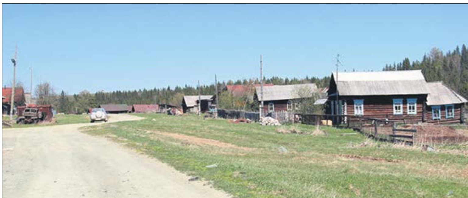
Деревня Кенчурка в наши дни.