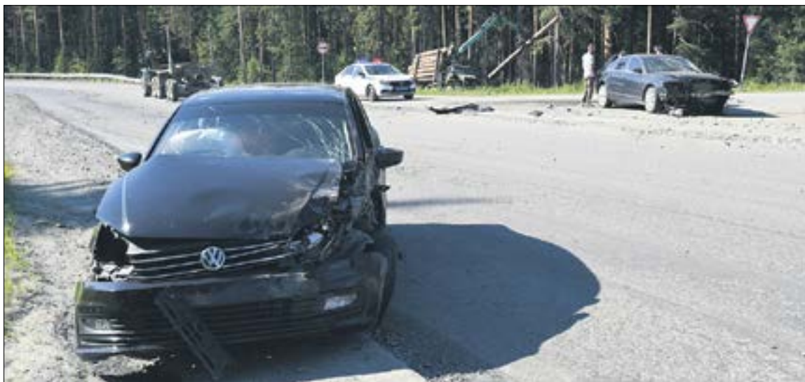
Водители не пострадали, но машинам предстоит дорогостоящий ремонт.

В обеих машинах сработали подушки безопасности, которые спасли водителей — никто не пострадал.