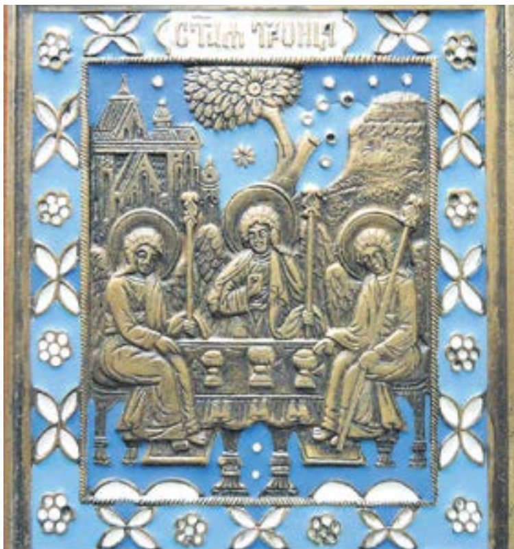
Литая старообрядческая икона «Троица».