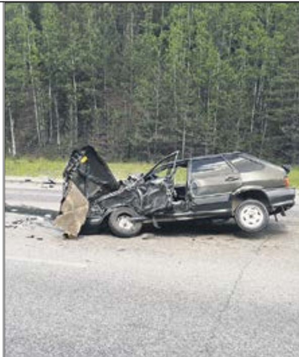
ВАЗ, на котором ехал виновник аварии, восстановлению не подлежит. Водитель чудом не пострадал.