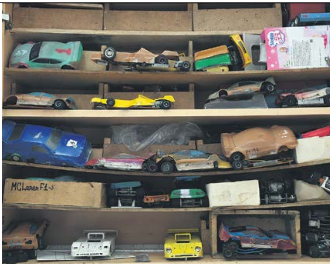
С комплектующими всегда есть проблемы из-за недостаточного финансирования. Поэтому используют все, что есть. А новое оборудование позволит делать новенькие корпуса из пластика.

— Пилот всегда едет на грани. Если медленно движешься и аккуратно, проигрываешь. Если слишком быстро, тоже проигрываешь. Важно смотреть, где затормозить перед поворотом, зайти на него с нужной скоростью, где максимально ускориться по прямой. Мастерство тут тоже нужно. Это технический вид