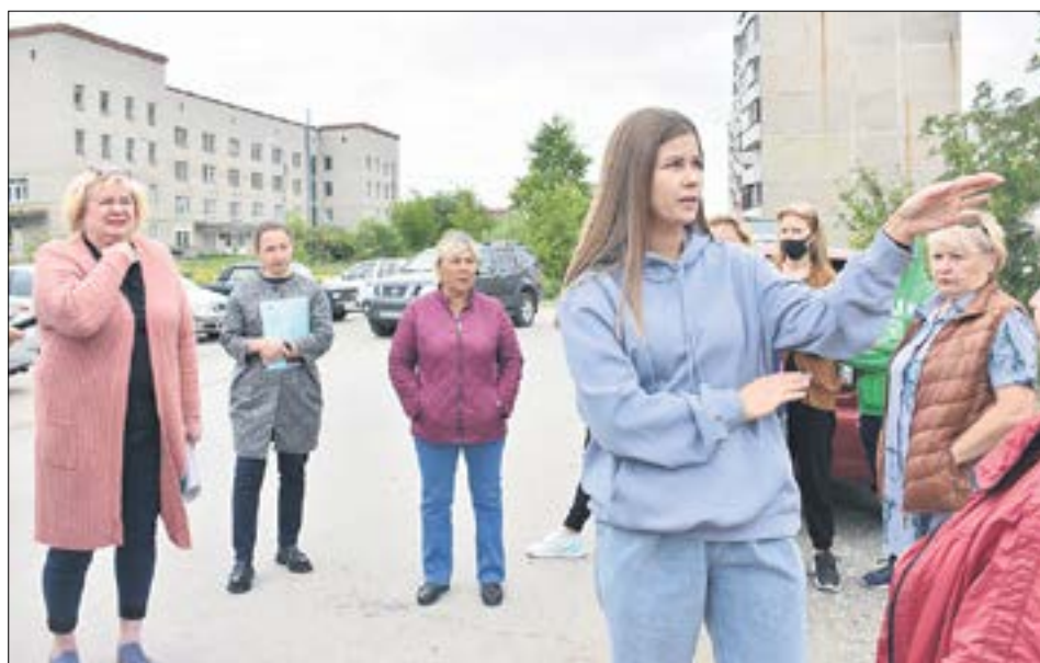
Жители дома говорят, что бомжи под окнами и постоянный бардак до того достали, что они готовы пойти на расходы, лишь бы изменить ситуацию.

нимум, заставить предпринимателей навести здесь порядок. А еще они хотели бы расширить свою придомовую территорию, чтобы поставить здесь нормальную спортивную или игровую площадку.