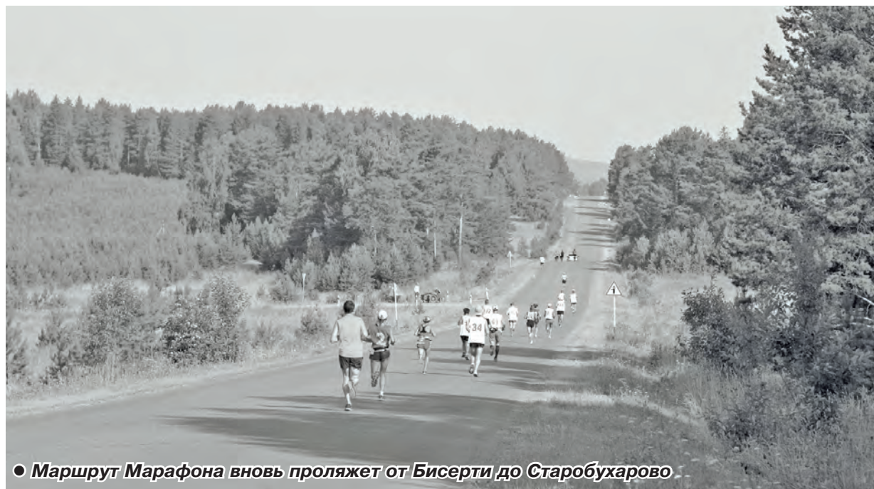
● Маршрут Марафона вновь проляжет от Бисерти до Старобухарово

Уже в эту субботу, 12 июня, состоится торжественное открытие нового сквера «Город мастеров» - к этому событию приурочено множество мероприятий самой различной направленности, от официальных до музыкальных.