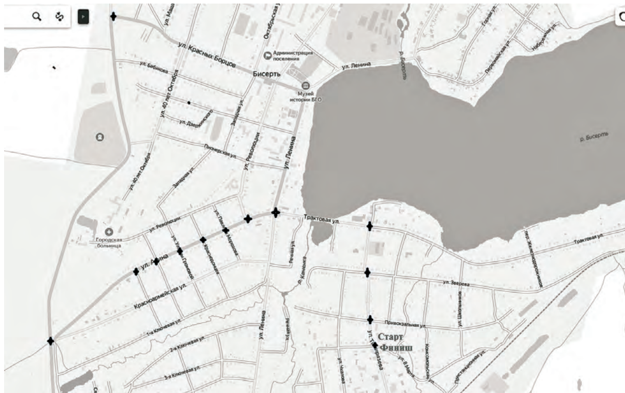
● Движение автомобилей по обозначенным участкам улиц 12 июня будет закрыто с 8:00 и до 14:00

Администрация Бисертского городского округа.