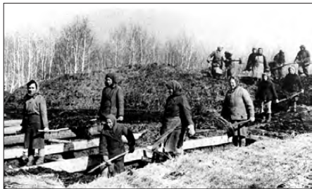
На строительстве парников. 1942 г. Колхоз «Новая жизнь» (Мартюш)