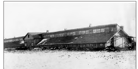
Свинарник в селе Колчедан

Несмотря на трудности, в 1944 г. Каменский район оказал помощь колхозам освобожденных районов, куда послано