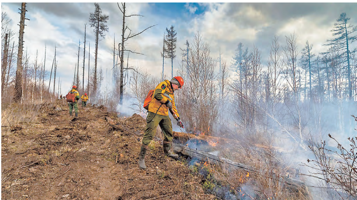
ПРЕСС-СЛУЖБА ФБУ «АВИАЛЕСОХРАНА»