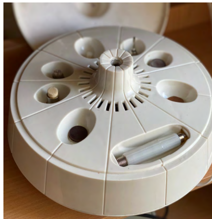
Электроманикюрный прибор «Славянка», хранящийся в Пелымском историко-краеведческом музее