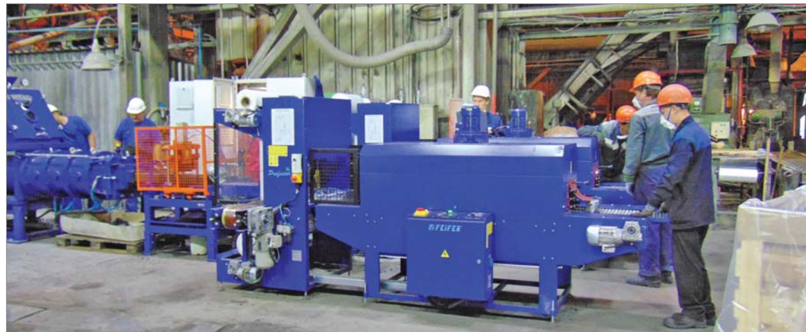
2017 год. На УПНО завершается монтаж новой автоматизированной линии по производству лёгочных масс.

«Обслуживая линии, делая необходимые доработки с учётом предложений операторов, в частности, на участке по производству корундографитовых изделий, я много почерпнул у коллег-томичей, - рассказывает инженер-программист ЛАСУТП Артём Устюжанин. – На новой линии после окончания периода бесплатного обслуживания Томс-