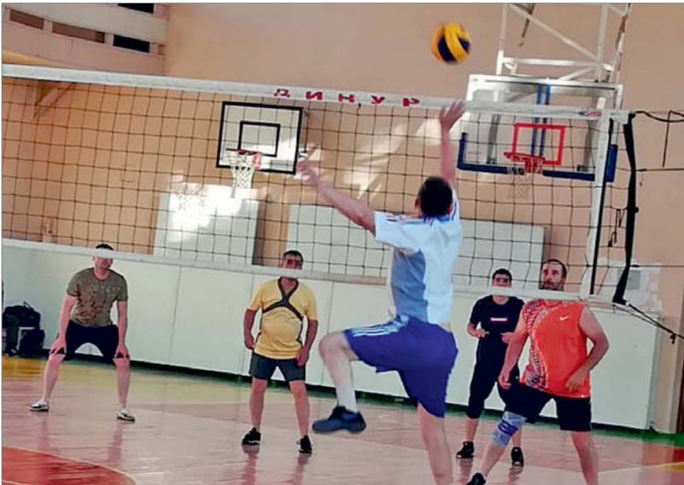
На площадке – команды цеха №1 и заводоуправления.

Среди коллективов второй группы пока состоялась только одна встреча, между сборными РСУ-энергоцех-СТКиК и рудник-ЦЗЛ-СЗС. В ней спортивное противостояние вылилось в результат 2:1. Победитель – команда рудник-ЦЗЛ-СЗС.