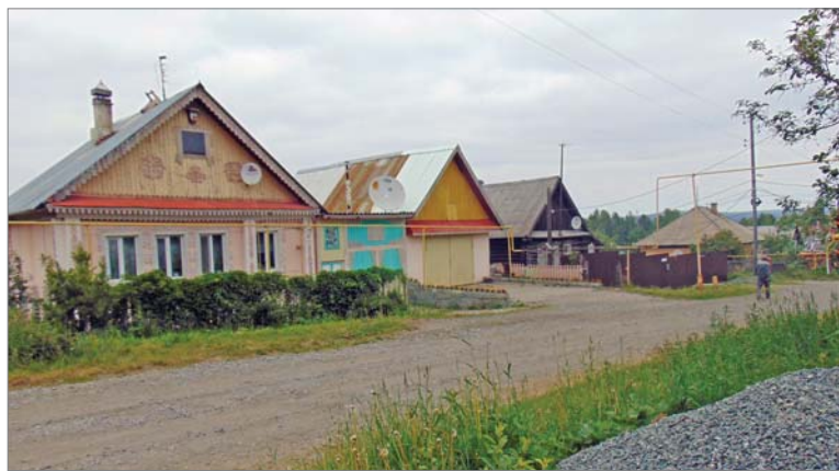
Историческая часть Калаты, улица Кирова.