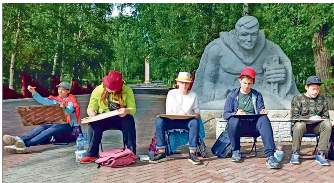
Четвероклассники художественной школы рисуют знакомые городские пейзажи. В этот раз - у проходной динасового завода.