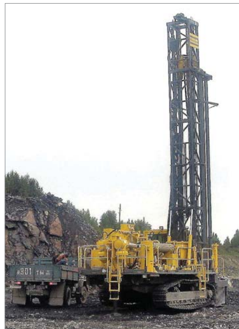
Шведский буровой станок – главное приобретение 2008-го.

Без преувеличения, главным приобретением-2008 стал буровой ста-