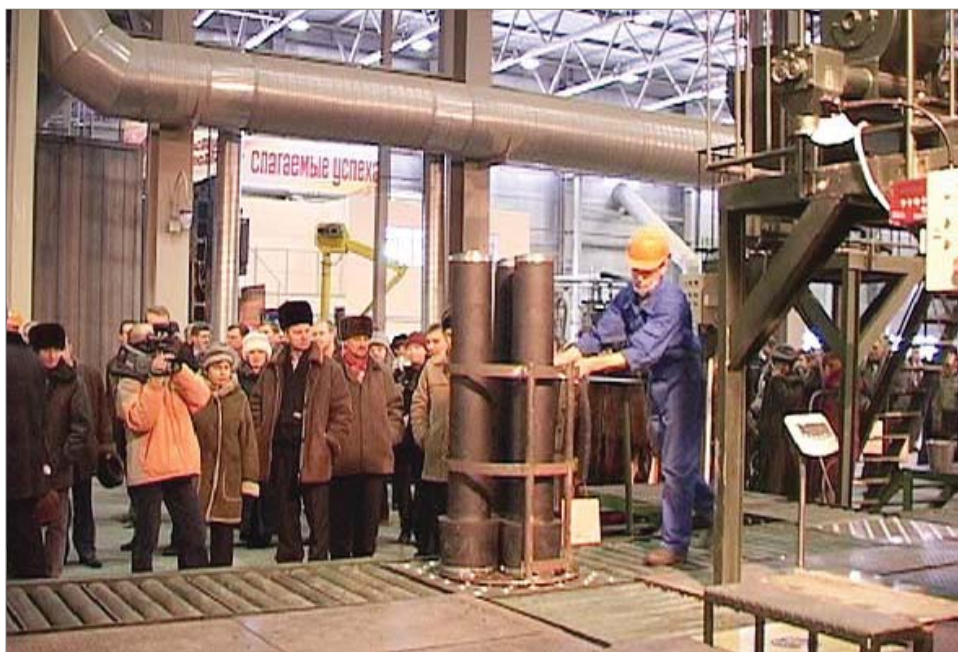
9 февраля 2006 года – открытие участка КГИ цеха №2.