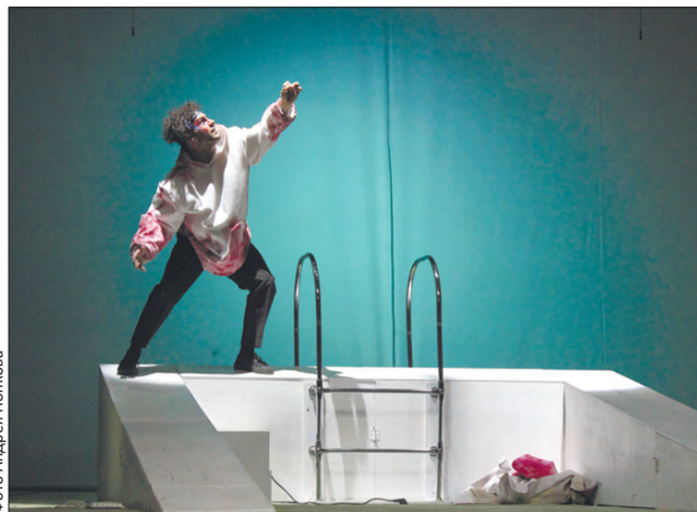
Внешний облик героев, рисунок роли «говорят» не меньше, чем слова

Этот поход в театр не назовешь обычным. Зрителями спектакля «Девять», где рассказывается о людях, оказавшихся в тамбуре жизни и смерти, стали первоуральские медики.