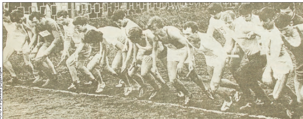
На старт... внимание...

Многие до сих пор помнят ленинский лозунг: газета – это не только коллективный пропагандист и коллективный агитатор, но также и коллективный организатор. И «Подзнаменка» этой формуле неукоснительно следовала. Одним из самых удачных починов редакции стала легкоатлетическая эстафета. Соревнование, стартовавшее в далеком 1934 году, переросло в традицию, которая существует по сей день.