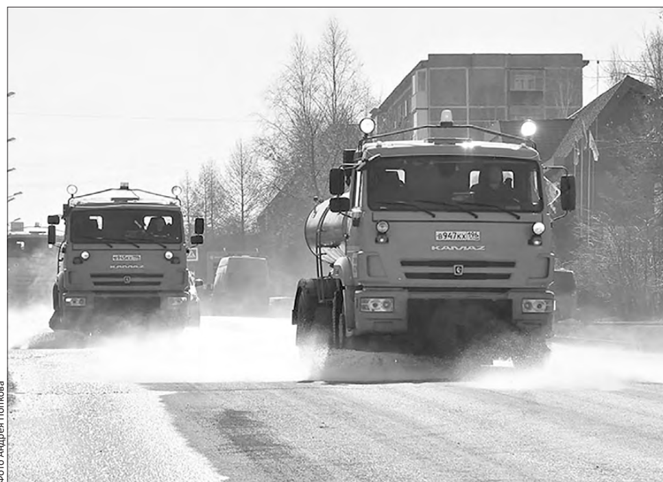
«Дождь» для городских дорог

Затем на проезжую часть выходят пылесос и КамАЗы, после чего КДМ проливают дорогу водой и сметаюют мелкие камни. Тракторы чистят аллеи и пешеходные переходы.