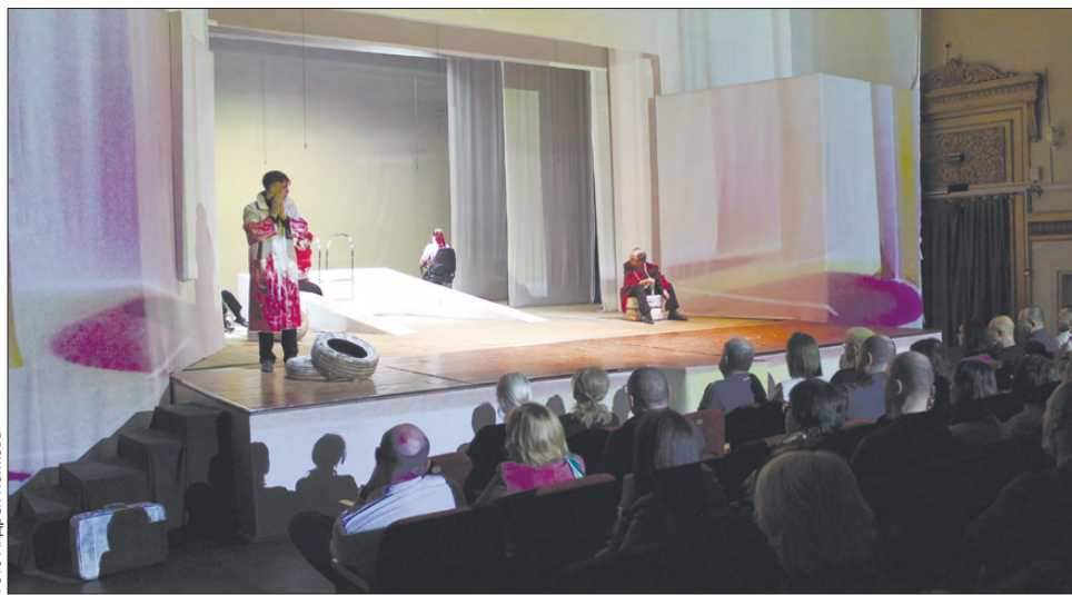
Зрители смотрели на происходящее на сцене затаив дыхание