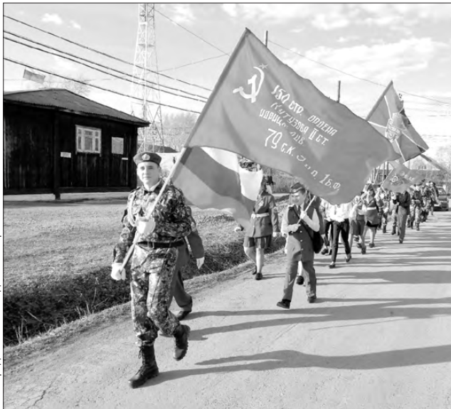
Под стягом Победы