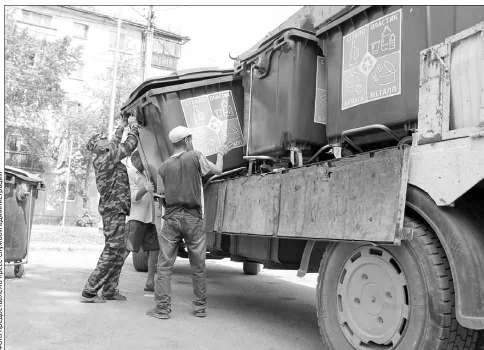
Новые контейнеры привезли в один из дворов на улице Малышева

Сообщать о площадке, которая, по вашему мнению, требует ремонта, можно в ПМБУ «Экофонд» по телефону: 64-21-65 или электронной почте: mu_ekofond@prvadm.ru.