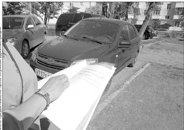
В мае на административную комиссию направлено уже 30 протоколов

Этим занимаются квартальные инспекторы. Напомним, в Первоуральске эти специалисты приступили к работе в конце марта этого года. Тогда они в первую очередь были озабочены уборкой и вывозом снега. Теперь особое внимание уделяют парковке машин в неположенных местах.