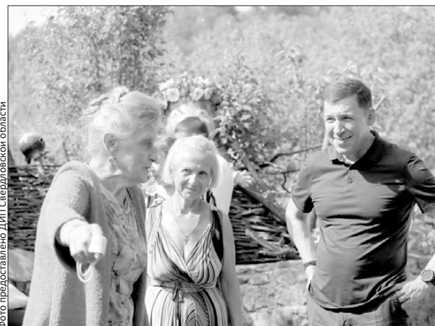
Меры поддержки садоводов обсуждаются на месте

— Мы это можем сделать на региональном уровне. По мере