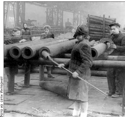
Первоуральск внес большой вклад в приближение Победы