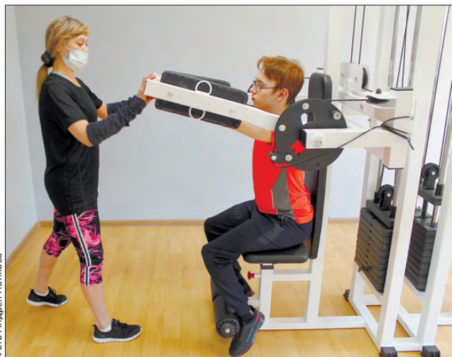
Нагрузка на плечевой пояс