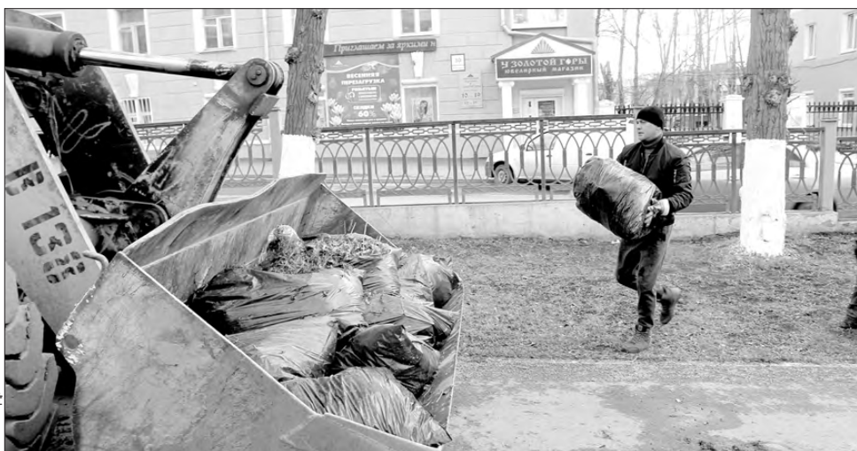
Вывозили мусор — централизованно

Взялись за дело, как и в прошлые годы, дружно — всем округом. В уборке участвовали не только коммунальщики, но и другие предприятия и организации города. Для уборки за ними были закреплены конкретные территории — улицы, аллеи, скверы. В субботниках участвовали, к примеру, представители администрации Первоуральска, работники АО «ПНТЗ», ОАО «ДИНУР», предприятия ЗАО «Русский хром 1915», ОАО «Уралтрубпром», сотрудни-