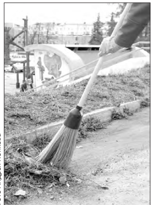
Уборка шла с 19 апреля по 19 мая

Первоуральск стал чище. Уже подведены первые итоги генеральной уборки города. Напомним, что в соответствии с постановлением главы администрации Первоуральска в период с 19 апреля по 19 мая в городском округе проходил месячник чистоты. За это время участниками многочисленных субботников было очище-