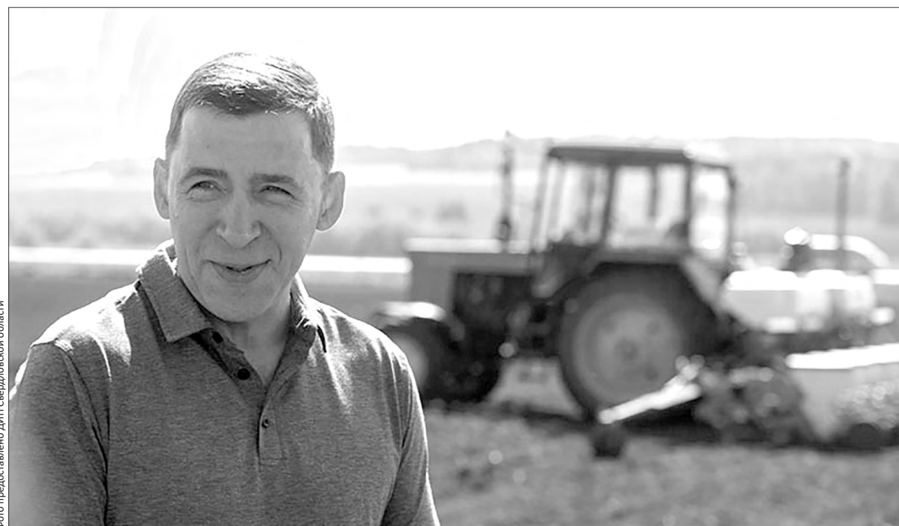
Губернатор считает, что уральские продукты сельского хозяйства должны быть в изобилии на местных прилавках

План ярового сева в целом в Свердловской области, по данным на 18 мая, выполнен на 60,2%. Зерновых культур — на 62,9%, технических культур на 95%, овощей открытого грунта на 63,8%, кормовых культур на 42,9%, картофеля на 40,7%. Посевные площади в этом году сохранены на уровне прошлого года. План — произвести 680 ты-