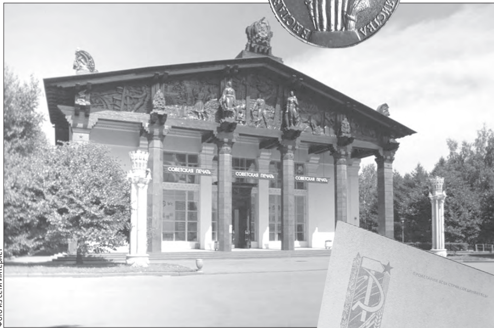
За годы своего существования павильон принимал совершенно разные экспозиции, не только советскую печать

Павильон «Советская печать», в котором экспонировалась «Подзнаменка», стал таковым лишь в 1967 году – за год до того, как на выставочных стендах ВДНХ появилась наша газета. Ныне это павильон №67, и его прежний облик постарались сохранить до наших дней. В 60-70 годы там демонстрировалась печатная техника: полиграфическое оборудование, буквоотливные машины и другие новейшие технические разработки – и образцы печатных изданий Советского Союза. Экспозиция раскрывала историю издательского дела начиная с первых дней советской власти. На стендах можно было найти печатную продукцию всех центральных и республиканских издательств СССР. Так, например, только в первый год существования экспозиции в ней было выставлено 6 тысяч образцов на всех языках страны. Возможность показать себя была и у «Под знаменем Ленина».