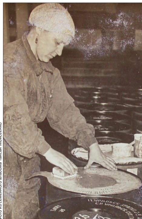
Наша героиня – за работой. 1965 год

– Начальство у нас было хорошее, или я тогда такая наивная была, – вспоминает женщина. – Коллектив хороший. В столовой, например, не наелась, пришла на раздачу, говорю: «Девки, не хватило мне», всегда добавят.