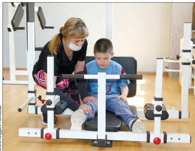
Главное не рекорды, а здоровье