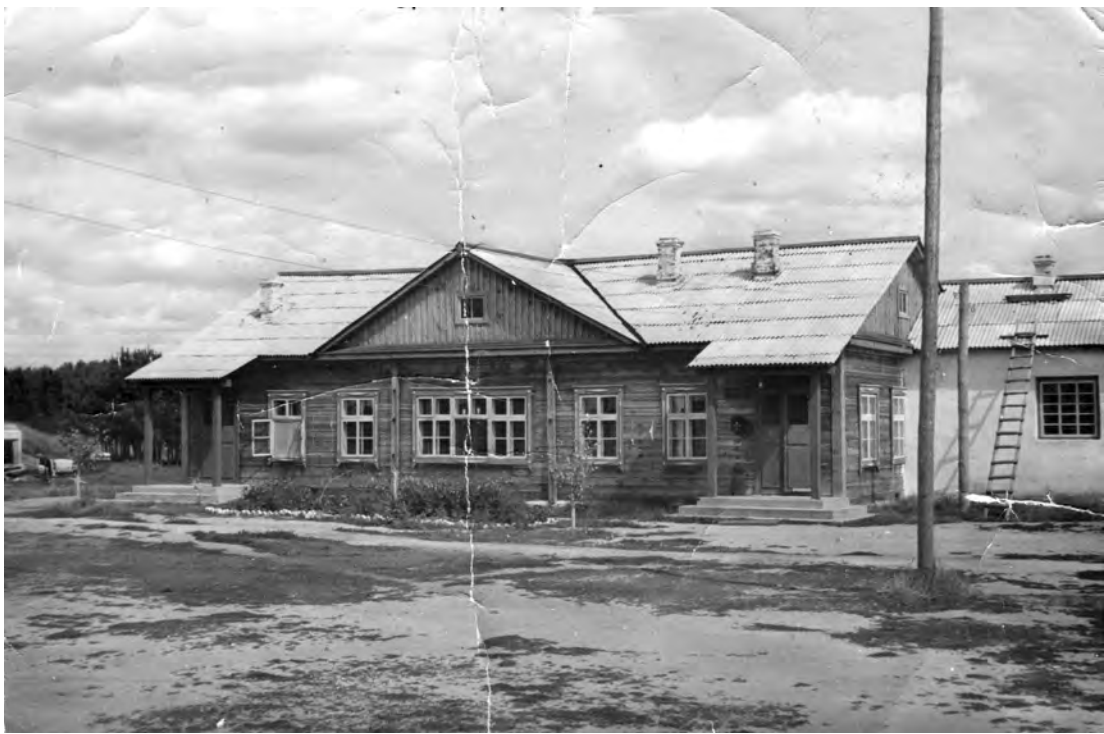
50-е годы прошлого века. Строительство Областной больницы «Маян». Первые постройки.