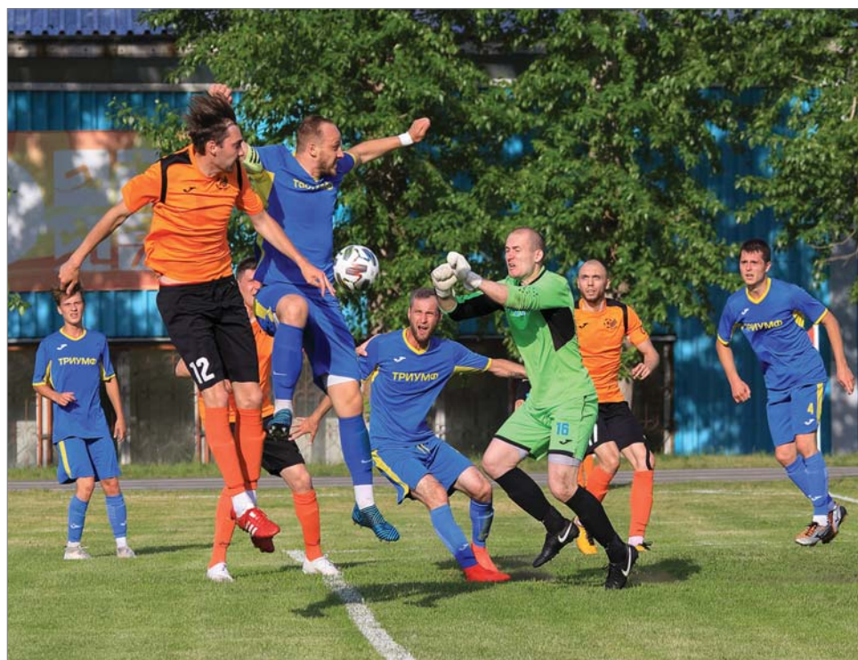
Все силы брошены на защиту.

- Основное – в первой группе участвуют 12 команд – в прошлом