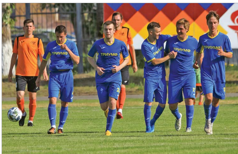
Ничья с «Динуром» - успех для «Триумфа».

Екатерина ТОКАРЕВА