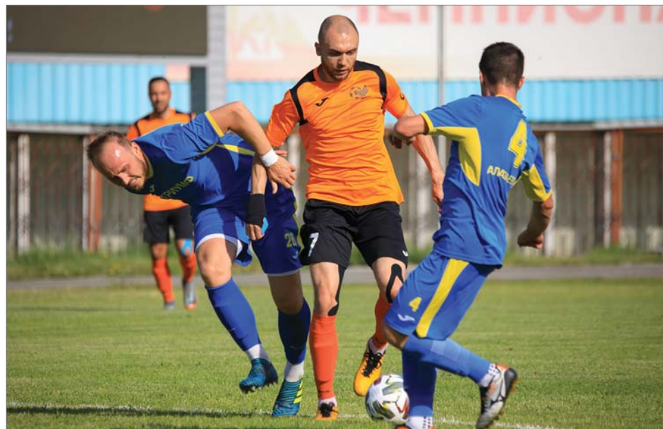
Капитан уверенно прокладывает курс.

ется – финансированию из госбюджета, энтузиазму, поддержке, такой, как от Первоуральского динасового завода?