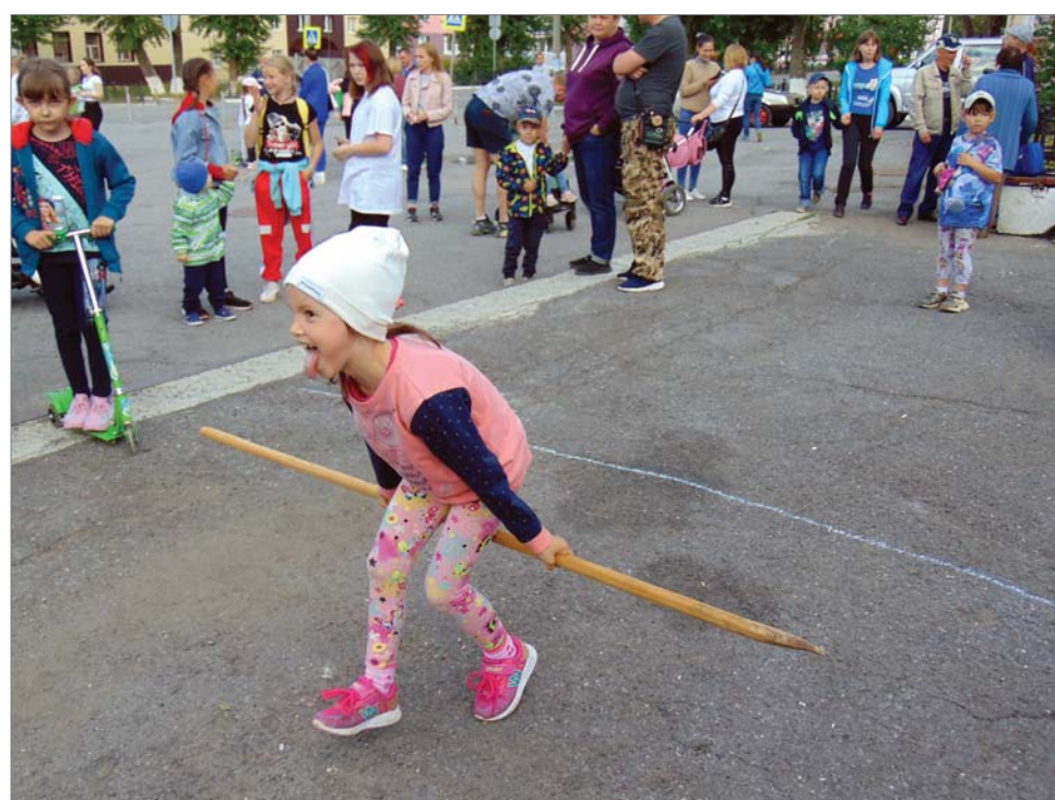
Ещё немножко - и финиш.