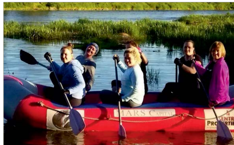
Команда «Дин@мо» вышла на тренировку.