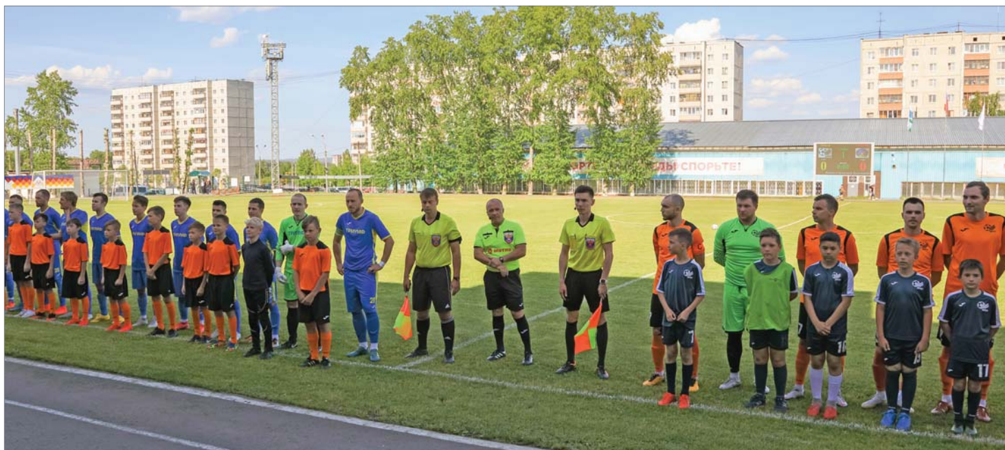
До начала матча – считанные минуты.