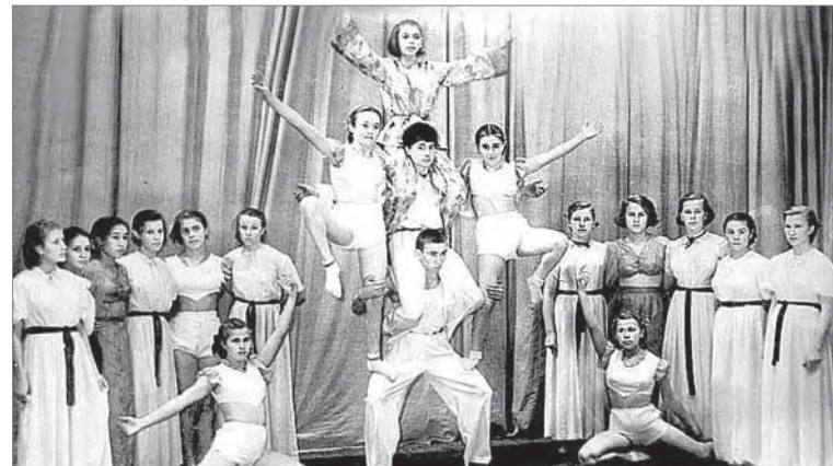
Цирковой коллектив представляет постановку «Каменный цветок», 1957 год.

Занятия в студии приучали ребят к труду, дисциплине. Любовь к непростому и зрелищному цирковому искусству участники из первого состава сохранили на всю жизнь.