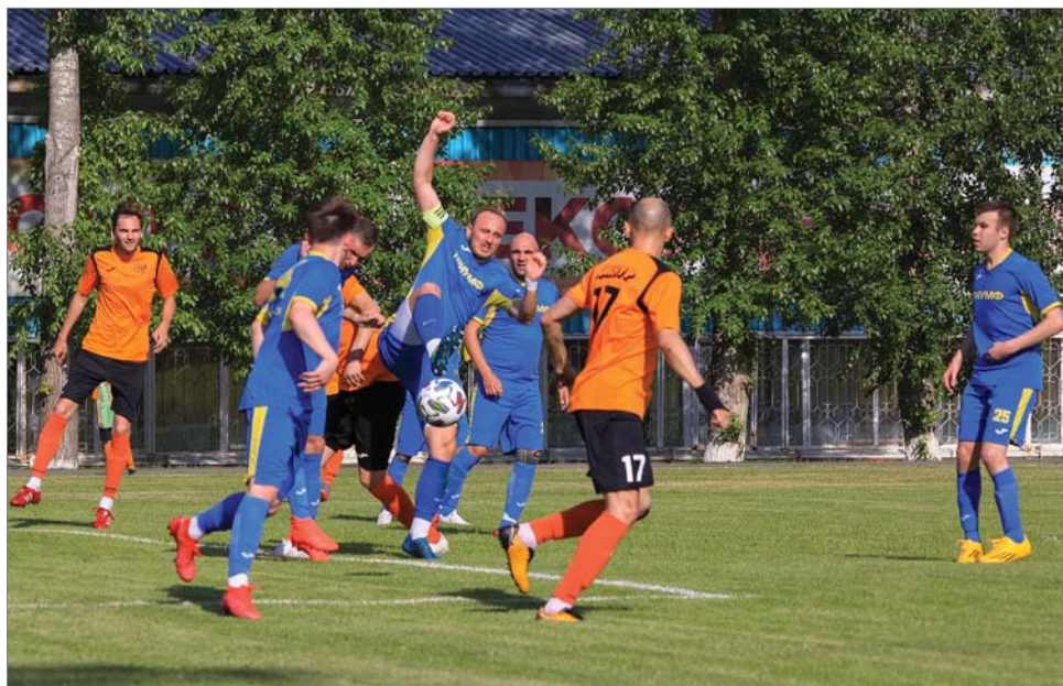
Борьба за мяч.