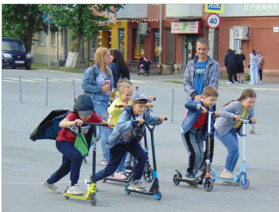
Мчимся быстрее ветра!