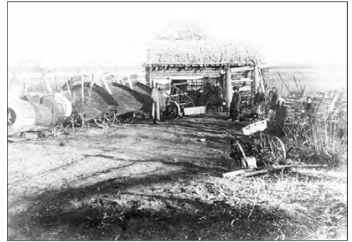
Двор Колчеданской МТС

Взаимоотношения МТС с колхозами строились на основании заключенных договоров на производство тракторных