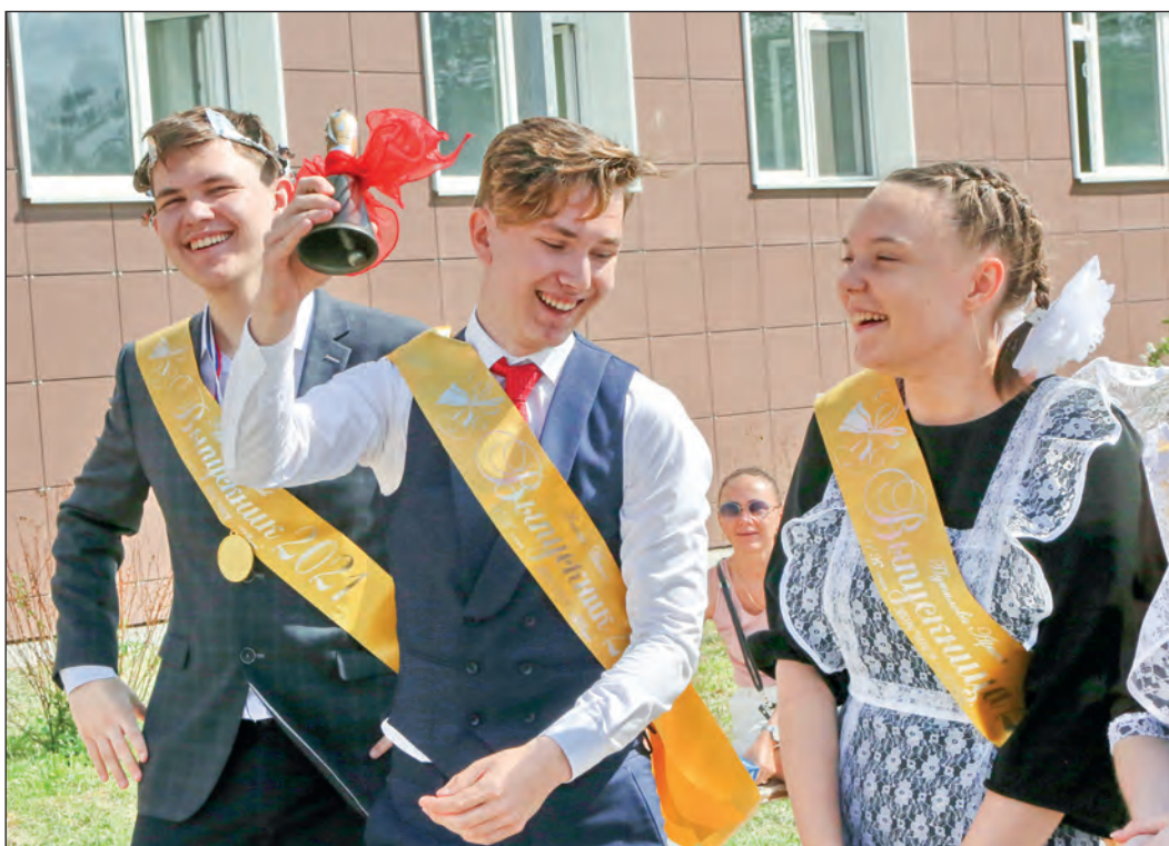
Прощай, школа, здравствуй, новая жизнь!