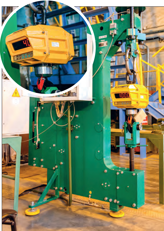
Новая самовоспроизводящая установка

20 мая метрологи Корпорации ВСМПО-АВИСМА отмечали свой профессиональный праздник – Всемирный день метрологии. И настоящим подарком к празднику для наших метрологов стала силовоспроизводящая установка для поверки крановых электронных весов, которой оснастили лабораторию механических измерений контрольно-испытательного центра ВСМПО.