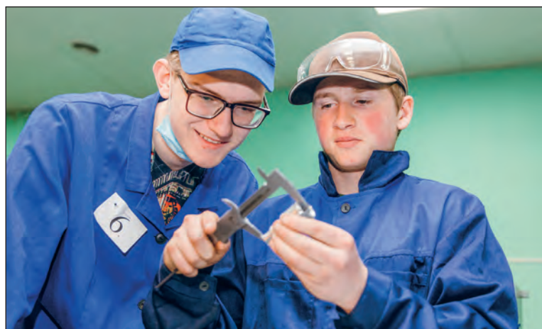
Студенты-наставники внимательно следили за попаданием в размер детали

Школьники приняли участие в корпоративных турнирах на «Лучшую работу своими руками»