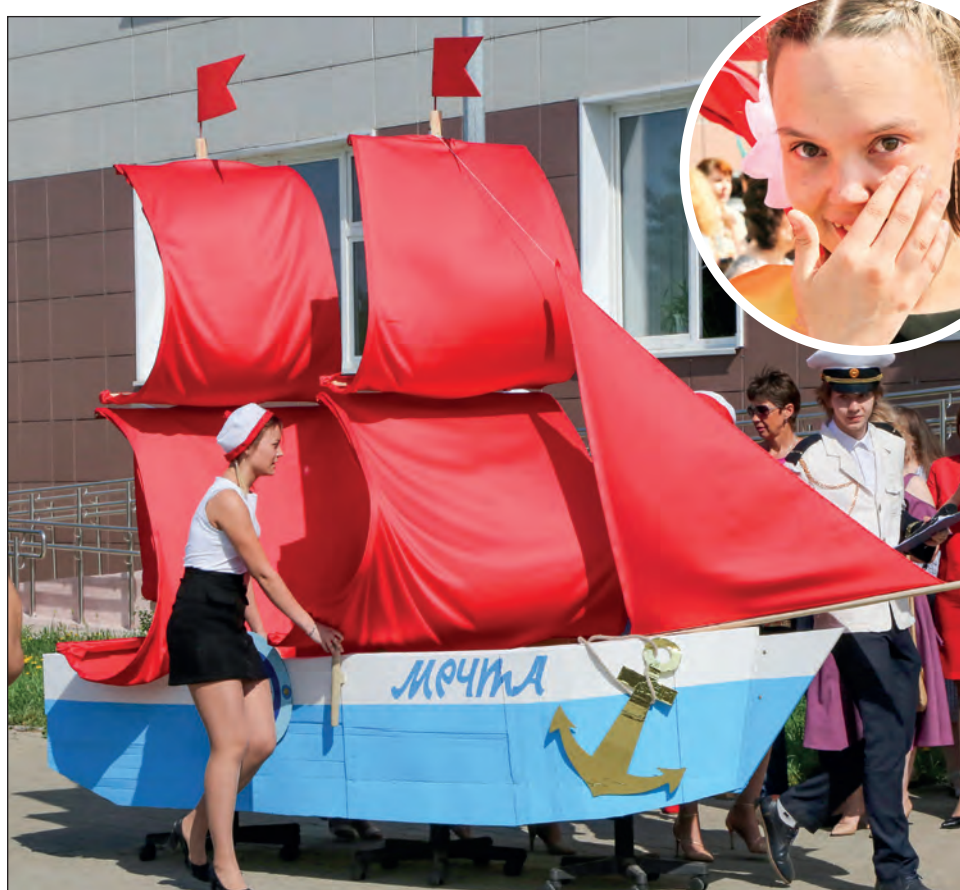
На Последний звонок в Пушкинской школе пришвартовались «Алые паруса»

– А я запомнила навсегда, как в пятом и шестом классах мы учились в школе № 6, а для нас в это время строили новую. Мы ездили в шестую в больших жёлтых автобусах. Это было настоящее приключение! Тогда-то, наверное,