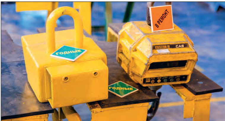
Весы в ожидании поверки