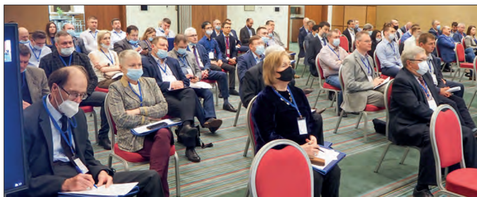
Доклады выступающих слушали очень внимательно, конспектировали и задавали вопросы