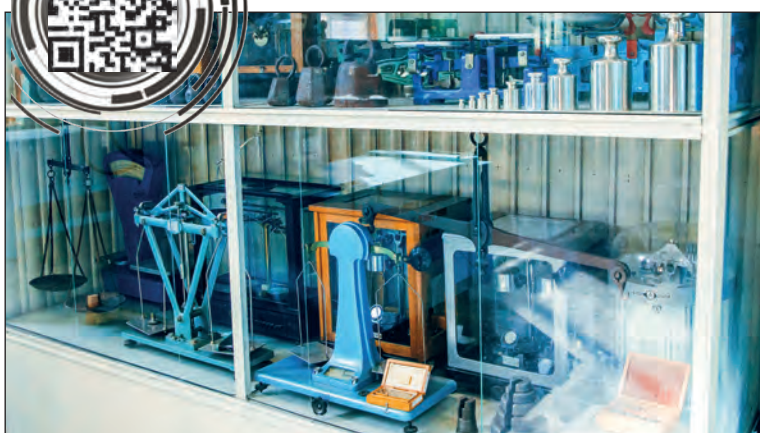
Музей эталонов в лаборатории механических измерений