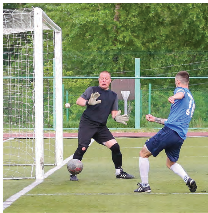
«Титан» уверенно штурмует ворота «Брозекса»

3:2! Отличное начало сезона! Поддержим наших футболистов 29 мая в 17.00 на стадионе «Старт».