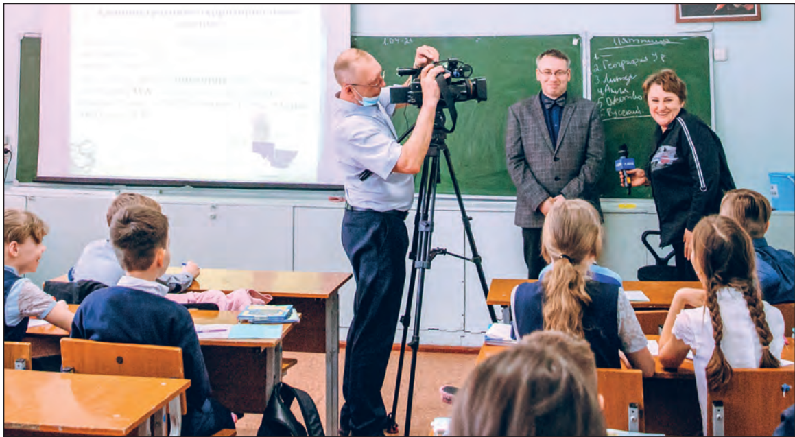
Когда интервью даёшь при учениках, то и общение с журналистами приходится делать элементом урока