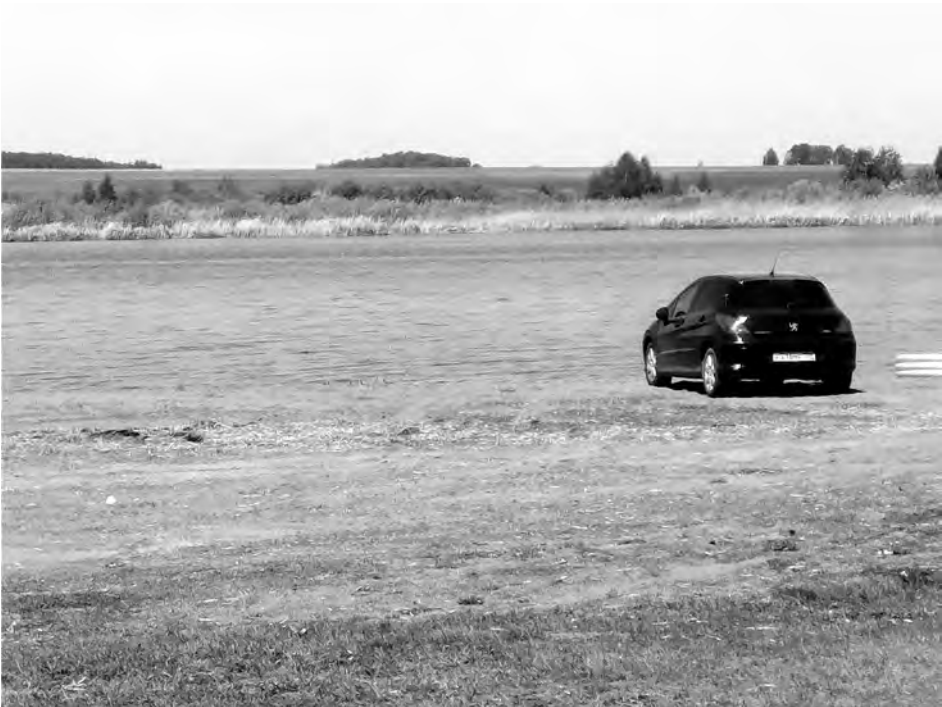
Ургинский пруд является водохранилищем на реке Урге, протяженность которой 20 километров. Согласно Водного Кодекса РФ ширина водоохранной зоны составляет 100 метров. Несмотря на отсутствие предупреждающих знаков, стоянка авто ближе 100 метров запрещена! На фото: Ургинский пруд, 21 мая 2021 год.

В прошлом году было составлено 15 аналогичных протоколов, по которым родители были вынуждены оплатить штраф. Причем купались подростки не только на Ургинском пруду, но и на городском.