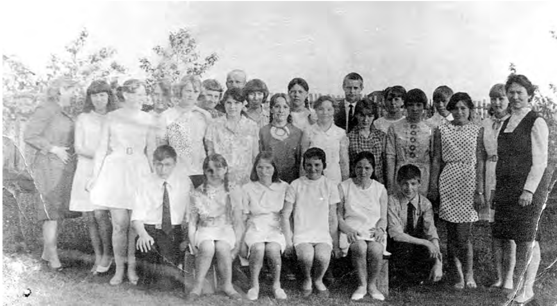
1971 г. Выпускной вечер (8 класс) в Б-Катарачской школе.

Фото можно принести в редакцию, а также отправить по электронной почте: gazeta-sn@mail.ru