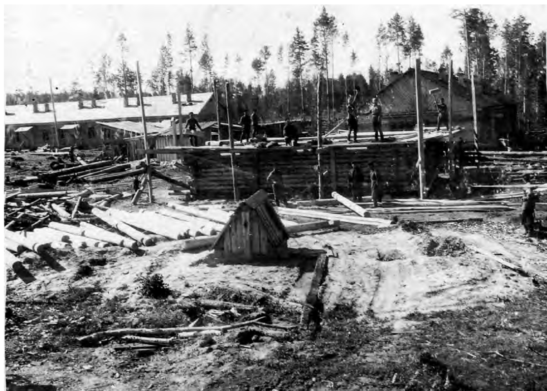
50-е годы прошлого века. Строительство Областной больницы «Маян». Первые постройки.