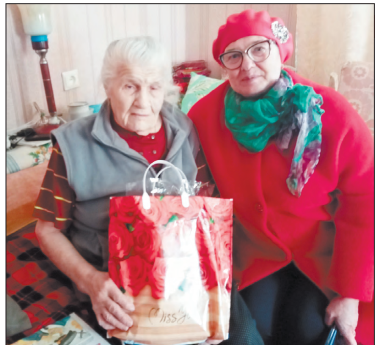
Подарки труженикам тыла