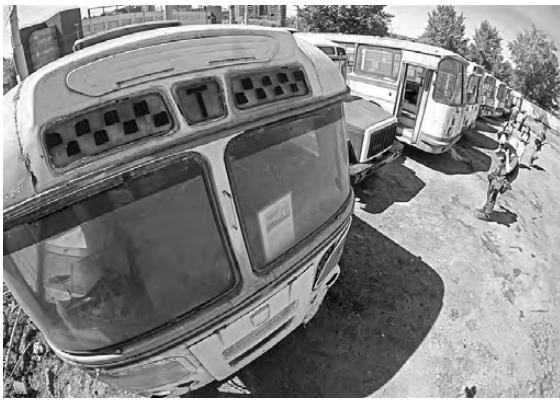
Сейчас на площадке будущего музея девять «Икарусов», ЛиАЗов и других автобусов, которые уже давно сошли с маршрутов.

Екатеринбургский МУП «Гортранс» год назад, к 95-летию предприятия, начал собирать и восстанавливать раритетные машины, которые станут экспонатами будущего музея ретроавтомобусов. Сейчас на выставке под открытым небом размещены девять машин, вскоре коллекция пополнится еще двумя, а площадка для показа будет переоборудована. В перспективе на предприятии планируют приглашать сюда на экскурсии всех желающих. Как рассказали в «Гортрансе», 2 мая 1925 года открылось регулярное автобусное движение в Свердловске: на маршруты вышли 12 автобусов марки Ford вместимостью 12 человек.