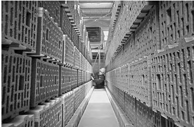
Заккрытие местного кирпичного завода скорее всего приведет к удорожа- нию строительства в Советском районе Югры.

И все бы ладно, да только Югорская межрайонная проку- ратура признала предприятие— уже второй раз начиная с про- шлого года—злостным наруши- телем требований технологичес- кой безопасности. А именно, об- винила в незаконной, по сути, эксплуатации газового оборудо- вания, на которую Ростехнадзор не давал разрешения, в специ- альный регистр его не занес. Подведенный к цехам газопро- вод, вроде легальный—за топли- во потребитель с поставщиком, насколько известно, рассчиты- вался. А вот подтвердить ответ- ственность за соблюдение прави- л и стандартов не удосужился.