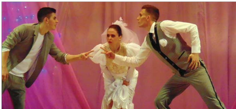
Невесте пришлось выбирать.