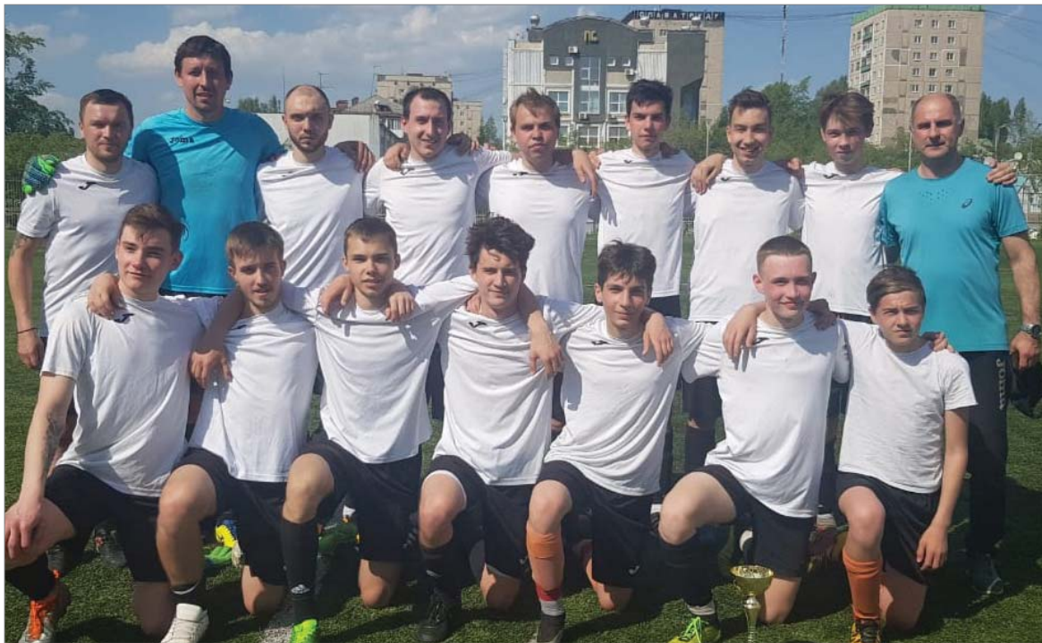
«Динур-Д» - победитель городского блиц-турнира.

Городская федерация футбола ежегодно проводит блиц-турнир среди коллективов физкультуры.