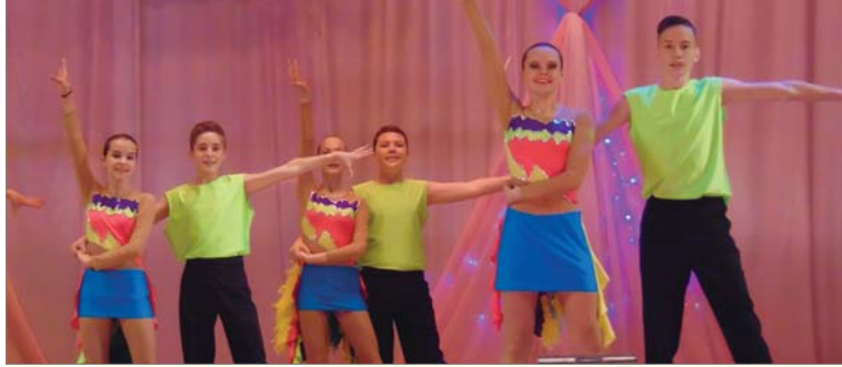
Каждый танец, как цветок в букете.