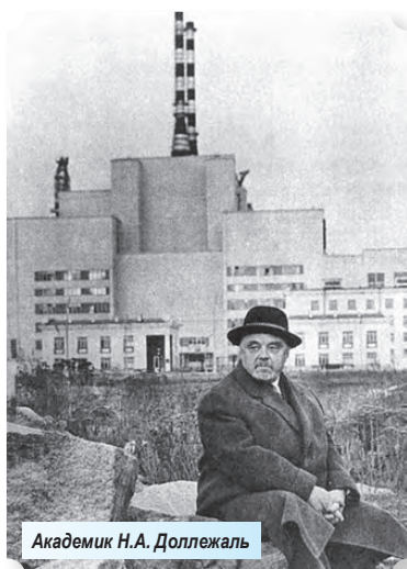
Академик Н.А. Доллежал