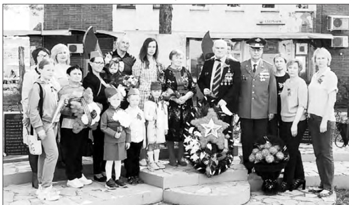
Администрация Каменского городского округа

В День Победы по всей стране прошли памятные мероприятия. В Каменском городском округе были организованы торжественные возложения цветов к мемориалам и обелискам. Перед траурной церемонией участники мероприятия почтили павших героев минутой молчания.