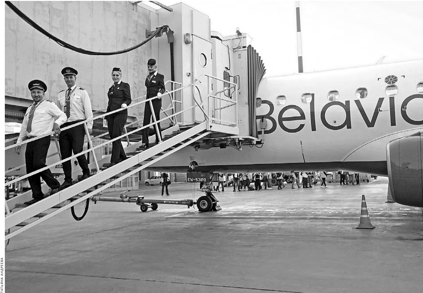
После четырехлетнего перерыва в екатеринбургском международном аэропорту Кольцово приземлился самолет из Минска. Прямые рейсы прекратились из-за низкого спроса, а в 2020-м из-за пандемии Россия вообще закрыла границу с Беларусью. В сентябре авиасообщение возобновилось между столицами, а в нынешнем году «Белавиа» начала возвращаться на региональные маршруты—пока в расписании всего девять направлений. Рейс в Екатеринбург выполняет самолет Embraer 175 вместимостью до 76 пассажиров.