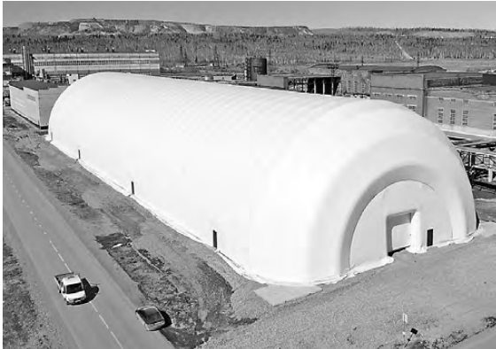
Размеры надувного ангара внушительные: длина составляет 134 метра, ширина — 35, а высота — 17 метров.

На Среднеуральском медеплавильном заводе (предприятия УТМК) появилась надувная конструкция из ПВХ. Сооружение будет служить складом медного концентрата, в него поместится 30 тысяч тонн. Дополнительное место для хранения понадобилось на период капремонта в медеплавильном цехе, когда снижаются нагрузки на печь и, соответственно, сырья перерабатывается меньше. Ангар, изготовленный предприятием из Санкт-Петербурга, установили менее чем за месяц, конструкция с дополнительным оборудованием обошлась в 32 миллиона рублей, тогда как на строительство капитального склада ушло бы около двух лет и не менее 200 миллионов.