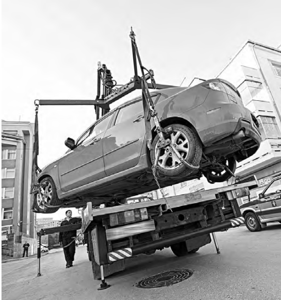
Когда закон будет принят и подписан губернатором, владельцы поврежденных машин смогут доказать вину эвакуаторов.