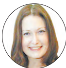
АВТОР ЕКАТЕРИНА ХОЛКИНА

Здоровье. Заведующий травматологией – о сезонных повреждениях; нелёгкой работе врачей в отделении и собственном пути в профессии