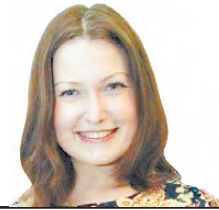
Материал подготовила Екатерина Холкина gorka-info@ rambler.ru