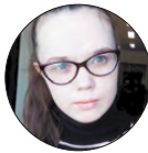
АВТОР АННА РЕЧКАЛОВА

Добро. Отдающие частичку себя: кто такие доноры крови и костного мозга