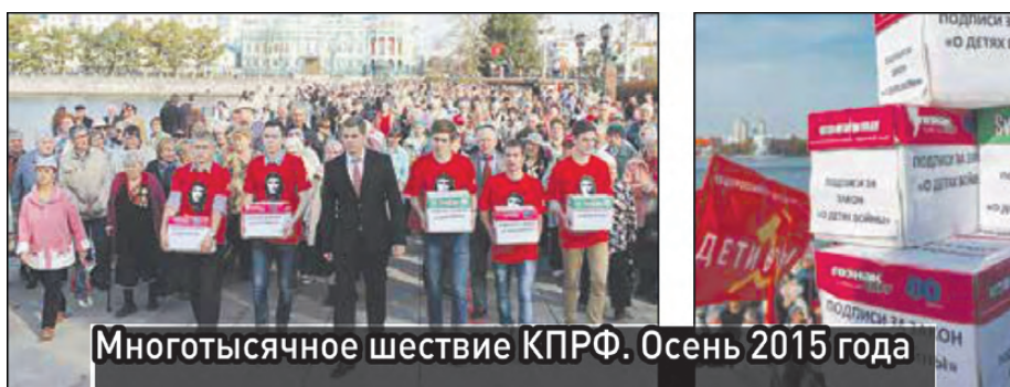
Многотысячное шествие КПРФ. Осень 2015 года

«В 2015-м жители Свердловской области сделали свой выбор в пользу общенародного областного референдума «О детях войны». В том году мы собрали требуемые российским законодательством 69 тысяч подписей, что составило 2% от числа избирателей региона.