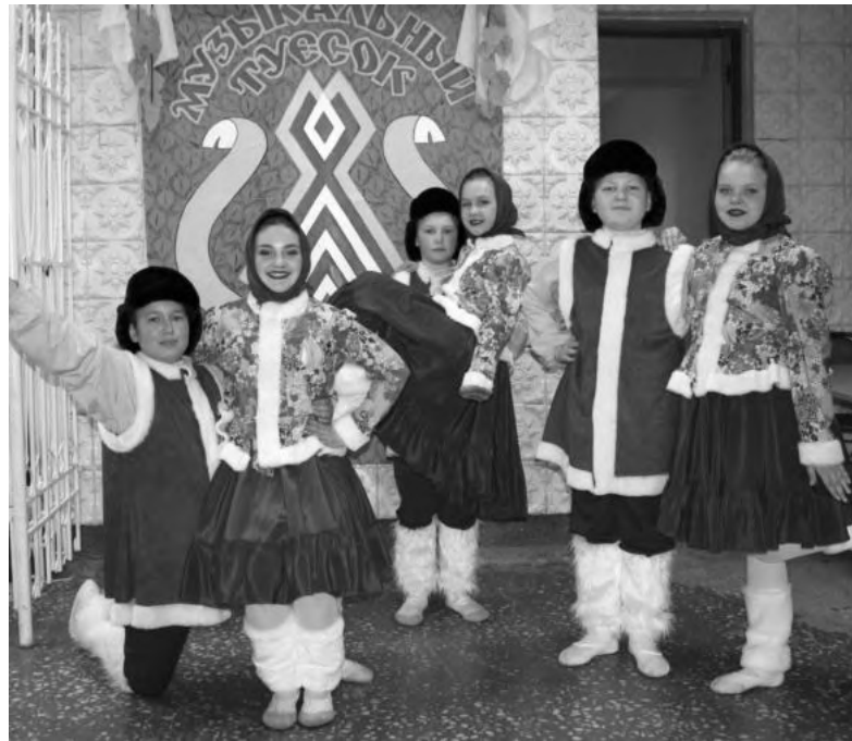
Ансамбль «Ажиотаж» (с. Ницинское)