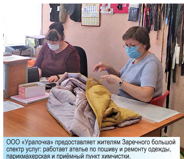
ООО «Уралочка» предоставляет жителям Заречного большой спектр услуг: работает ателье по пошиву и ремонту одежды, парикмахерская и приёмный пункт химчистки.