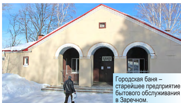
Городская баня – старейшее предприятие бытового обслуживания в Заречном.