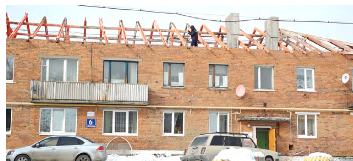
В Курманке в этом году уже начал капремонт домов по ул. Юбилейная, 6, 7, 8.

ности. Так, в начале года предприятие завершило постоянную регулировку тепла на ул. Юбилейная, 2а в Курманке – в среднем подъезде установили регулировочные краны, чтобы обеспечить равномерное распределение тепла по всему дому. Угловые квартиры теперь получают столько же тепла, сколько квартиры в среднем подъезде этого большого 4-этажного дома. Вообще регулировочные краны на отопление установлены сейчас по всей деревне, благодаря чему то тепло, что выдает котельная, можно более качественно распределить. Уже нет такого, что в одном доме люди форточки открывают, а в другом замерзают.