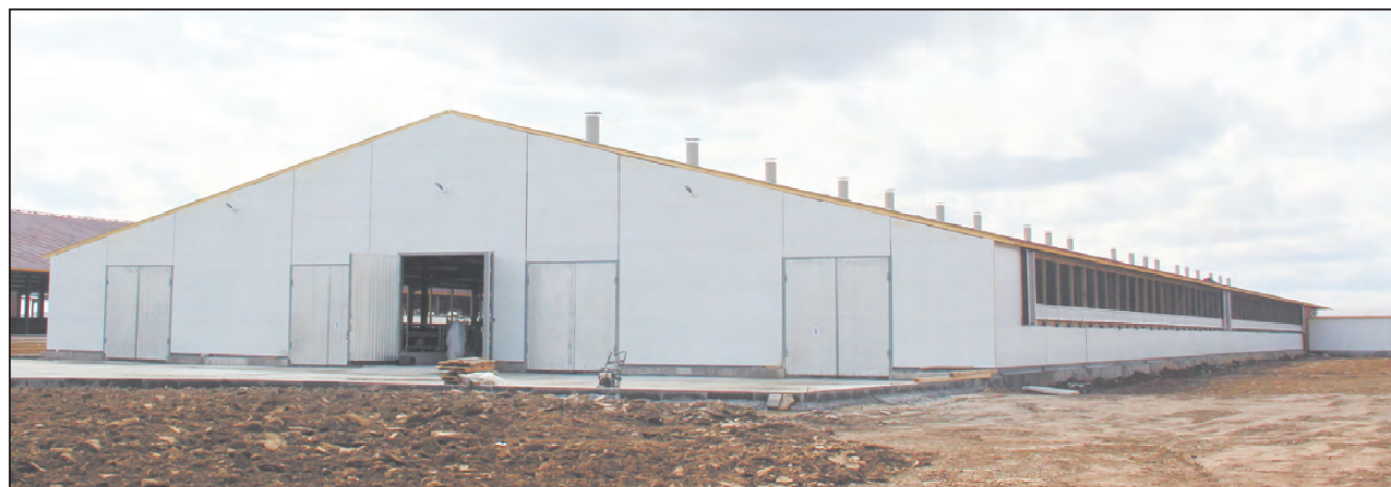
Корпус уже действует

К молочно-товарному комплексу ведет отсыпанная дорога. Один корпус уже готов (строители возводят остальные). К нему мы направляемся. Завезены 350 нетелей (животных привозят теперь постоянно), все они закуплены в племенных хозяйствах Свердловской