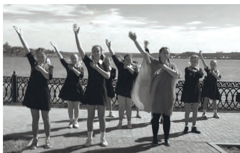
● Бисерть. Фрагмент из онлайн-концерта, подготовленного МУК «ЦКД МБ и СД «Искра»