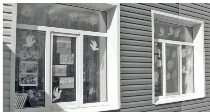
● Детский сад «Рябинка» участвовал в акции «Окна Победы»