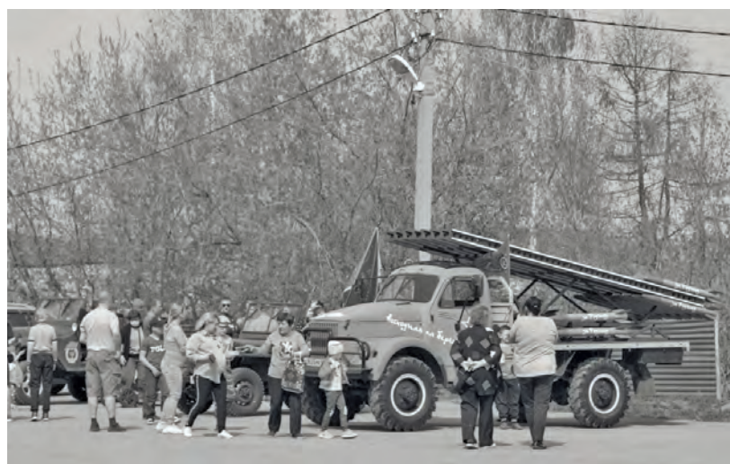
● Бисерть. Дети фотографировались у военных машин