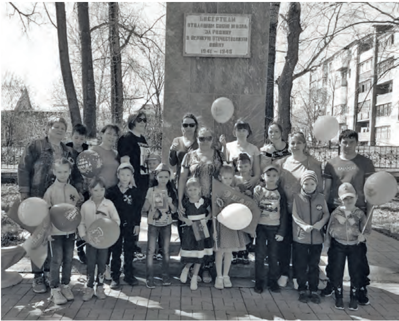
● Дети подготовительной группы детского сада «Рябинка» с родителями и воспитателем в сквере на площади Победы