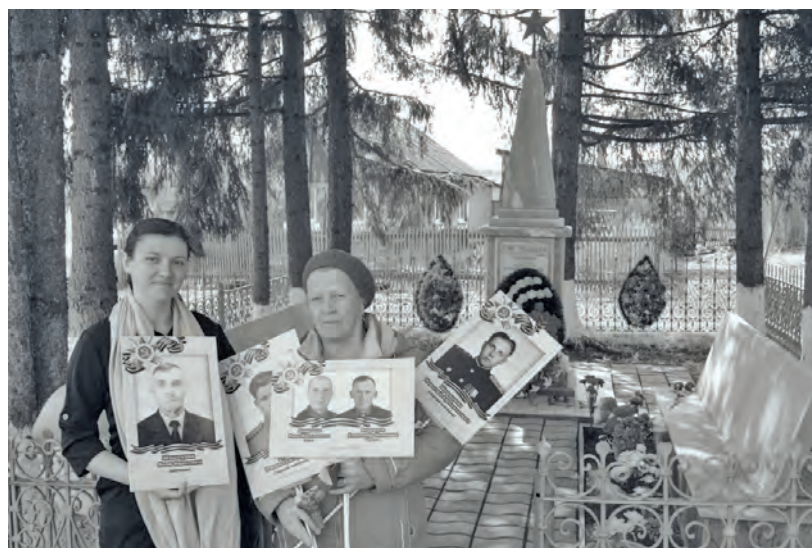
● Киргишаны. Жительницы села с портретами своих фронтовиков