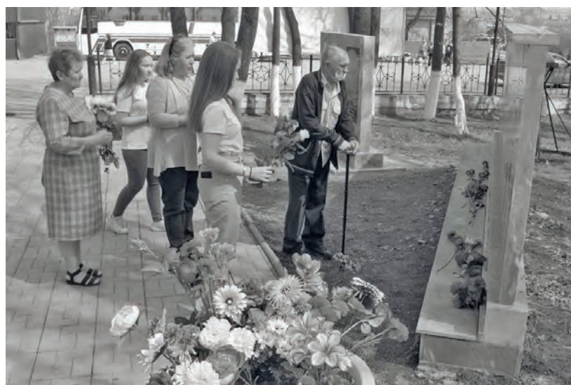
● Бисерть. Жители возлагают цветы к памятнику бисертцам-воинам ВОВ, умершим в послевоенное время