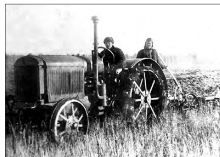
Первый колесный трактор 4ТЗ в Колчедане. 1934 г.