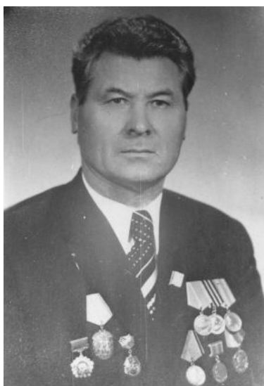
и был отправлен на фронт».