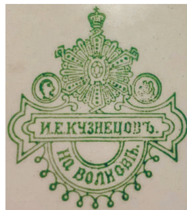
Клеймо И.Е. Кузнецова

В 1902 году продукция фабрики И. Е. Кузнецова на Волхове стала поставляться ко Двору Его Императорского Величества (Матвей Сидорович также был удостоен