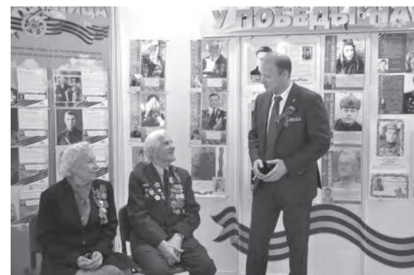
С Днем Великой Победы!

Здоровья вам, дорогие наши ветераны, труженики тыла, дети войны! Успехов нашим воинам, проходящим службу в рядах Вооруженных сил! И всем нам – мирного неба, майского солнца, доброты в душах и тепла в сердце!