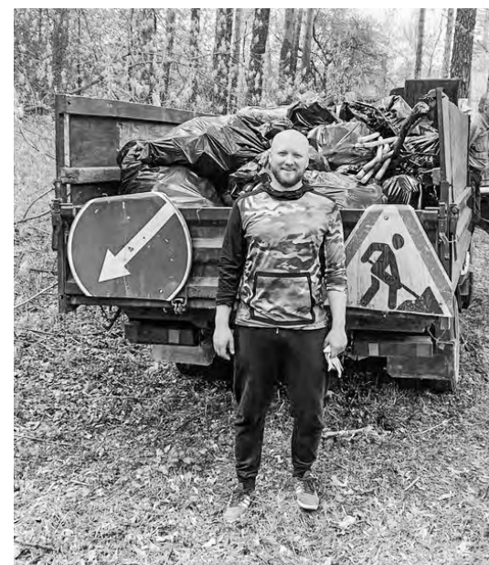
Собранный общественниками мусор вывезли на Газели