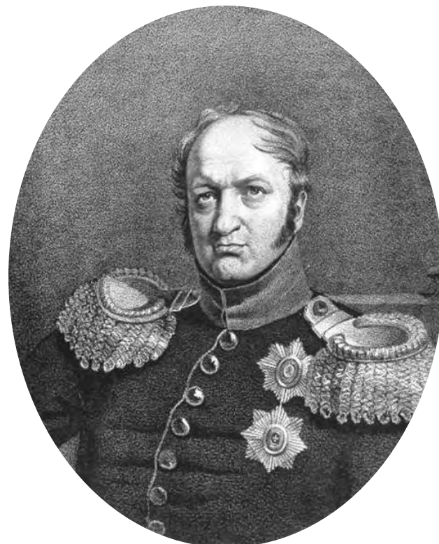
Егор Францевич Канкрин (1774–1845)