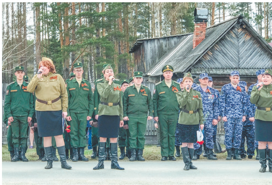
На уличной сцене – ансамбль «Рябинушка»

– Друзья и товарищи! Мы не жалели своей жизни, исполняя свой долг перед Родиной. Сколько нас полегло... Мы старались на войне для того, чтобы наши люди российские жили лучше всех. Да, мы никогда не лезем ни на кого, но пусть и на нас никто не лезет! А если придется защищать страну, то обязательно встанем в этот строй и победим!