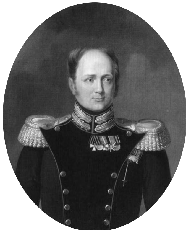
Александр I Павлович (1777–1825)