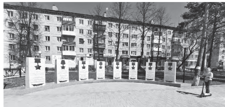
Украсить стелы бронзовыми орденами - идея руководства "Жилкомстроя"

К 9 Мая артемовский сквер Победы значительно преобразился.