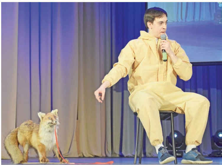
«Мистер КВН» — несравненный Савелий Вязовецкий