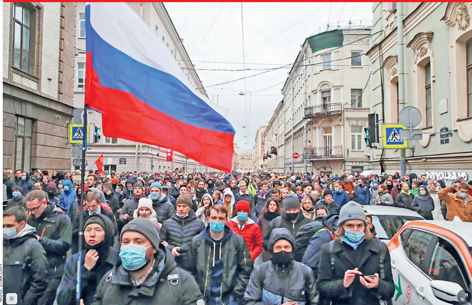
Шествие в Санкт-Петербурге.

Тысячи человек по всей России вышли поддержать Алексея Навального