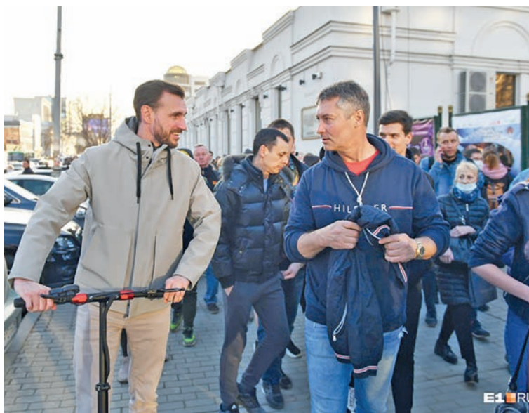
Евгений Ройзман на акции в Екатеринбурге.

Незадолго до акции стало известно, что база с элек-