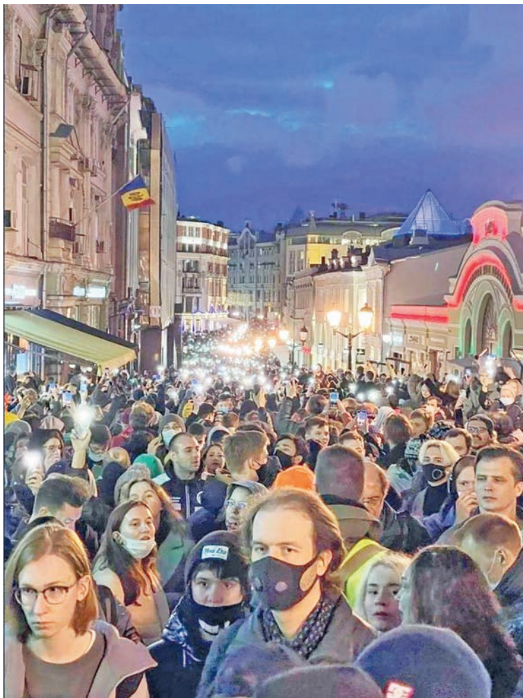
Центр Москвы 21-го апреля

тронными адресами людей, зарегистрировавшихся на сайте «Свободу Навальному», была похищена и слита в сеть. Людям стали приходить письма с угрозами.