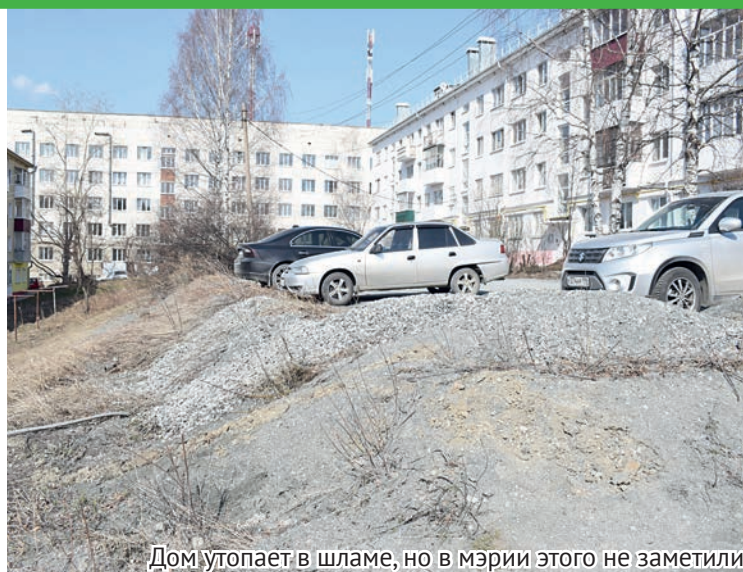
Дом утопает в шламе, но в мэрии этого не заметили

Инициативу ветеранов местные депутаты поддержали единогласно. На основании этого обращение в Заксобрание и Госдуму будет направлено от лица местной думы и «Союза ветеранов Афганистана».