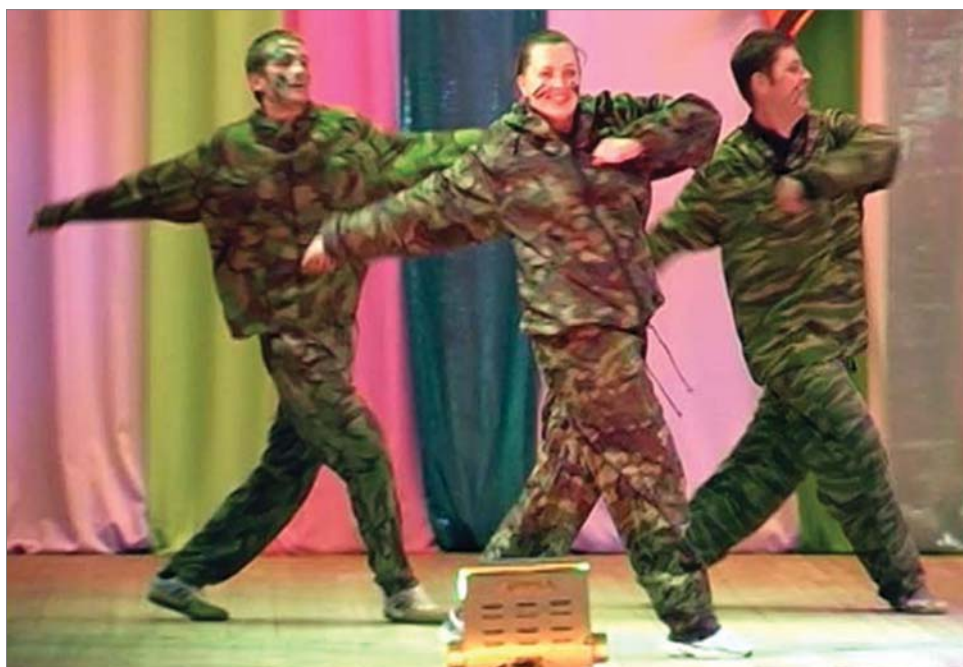
2015 год. На фестивале народного творчества – цех №1.

Сохранить память о великом событии, невзирая на минувшие десятилетия – долг потомков, о котором заводской коллектив не забывает.