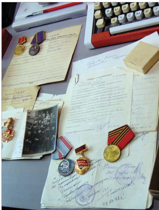
Награды динасовцев, прежде не выставлявшиеся в музее.