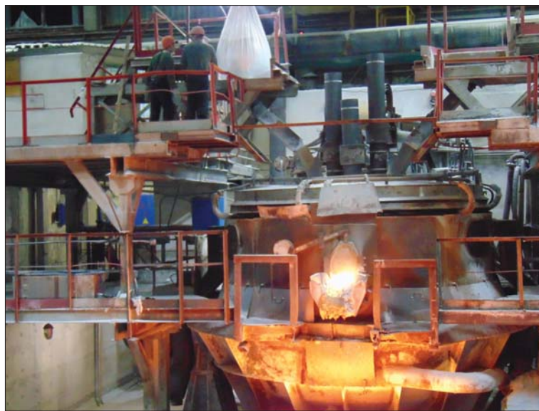
Плавка корундов ведётся во втором цехе круглосуточно.

Участки первого цеха загружены на весь месяц. Сохраняется большой спрос на плиты, выпускаемые на УПФО – 1357 штук надо