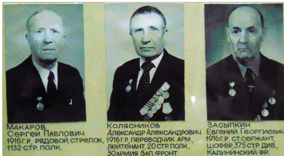
Так выглядит галерея портретов фронтовиков в музее.