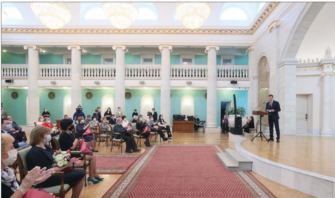
Героев церемонии приветствует губернатор Евгений Куйвашев.