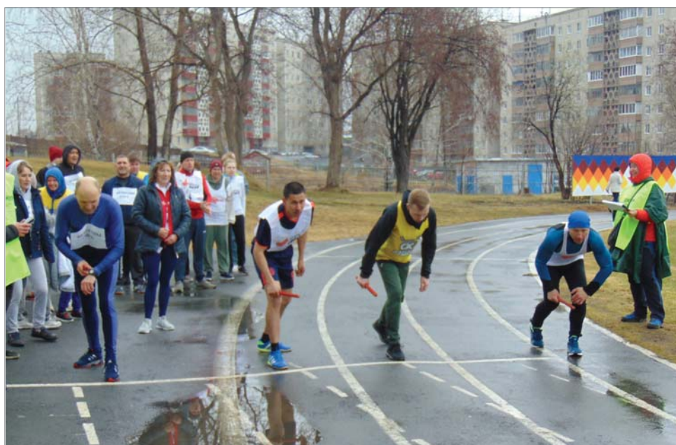
На старте - участники второго забега.

Легкоатлетическую эстафету на призы «ДИНУРА» ждали давно, поэтому ни дождь, ни холодный субботний ветер не могли повлиять на её старт и спортивное настроение участников.