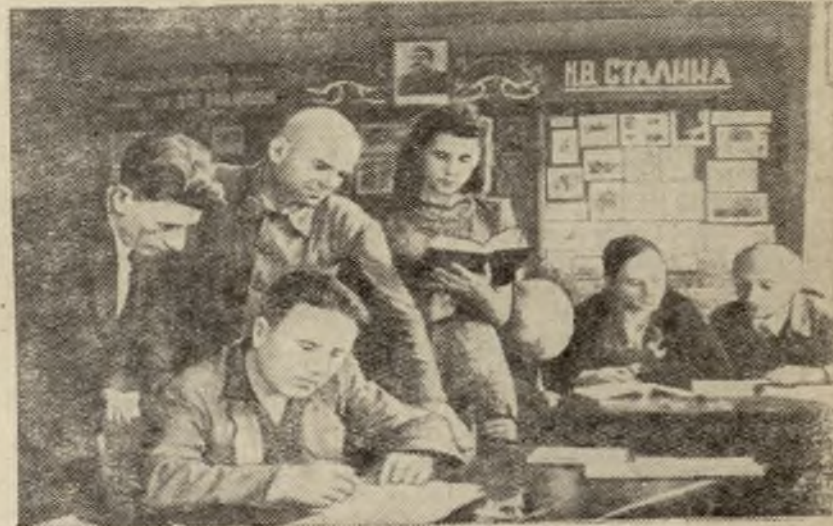
Украинская ССР. Партийная организация харьковского завода «Свет плахтера» хорошо поставила дело по повышению идейно-политического уровня коммунистов. На снимке: в партийном кабинете завода.