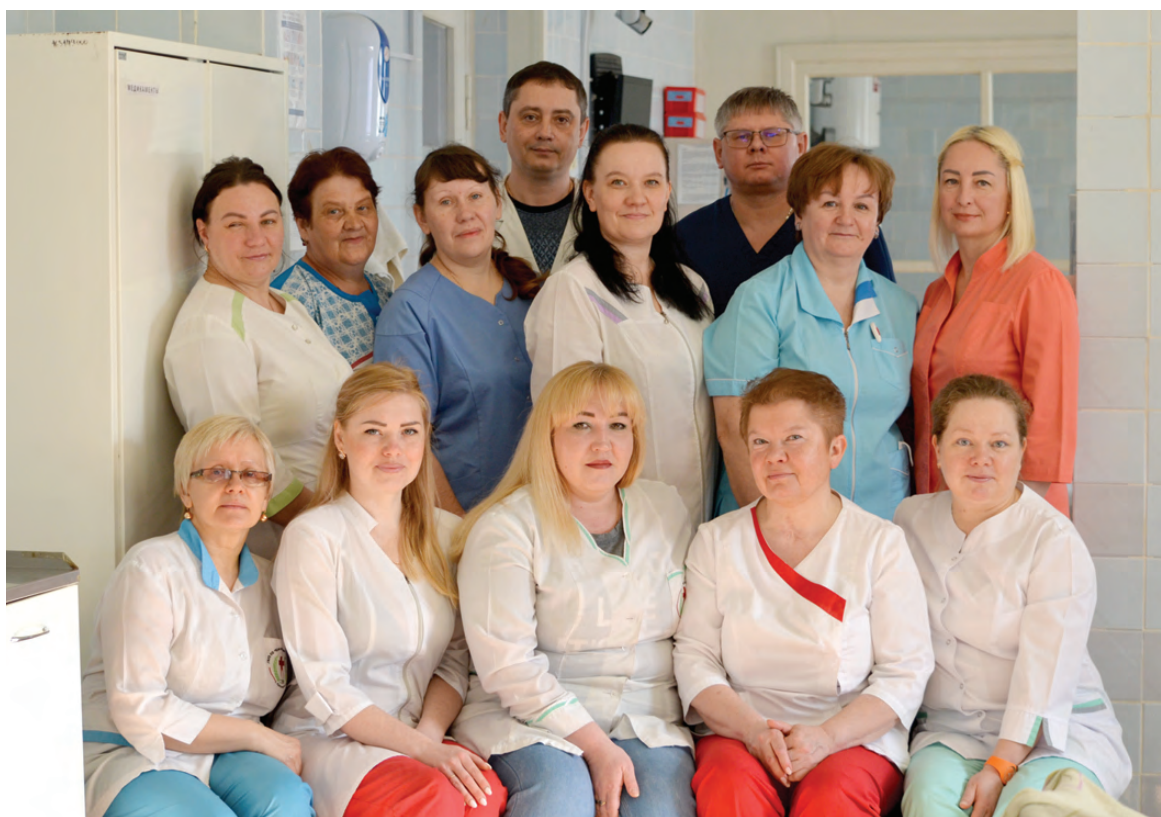
Коллектив отделения реанимации

Отделение анестезиологии и реанимации работает круглосуточно. У сотрудников очень напряженный график и очень мало выходных. Так как в боль-