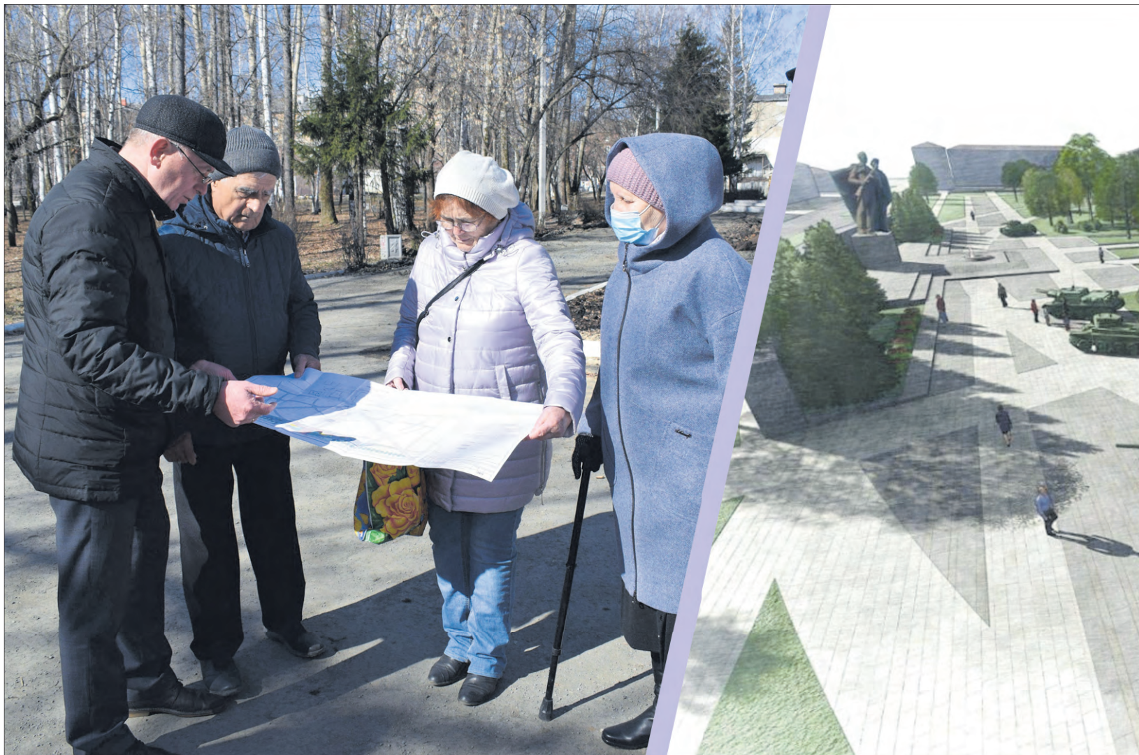
Фото для коллажа: пресс-служба мэрии, эскиз из проекта благоустройства

■ Первый вариант: железобетон, керамогранит,