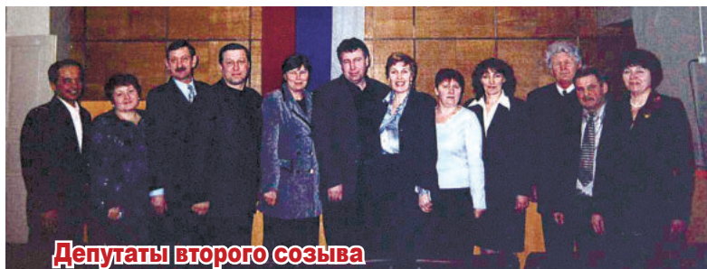
Депутаты второго созыва