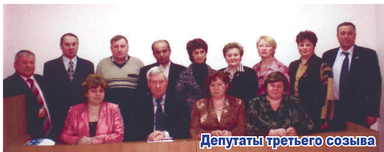
Депутаты третьего созыва