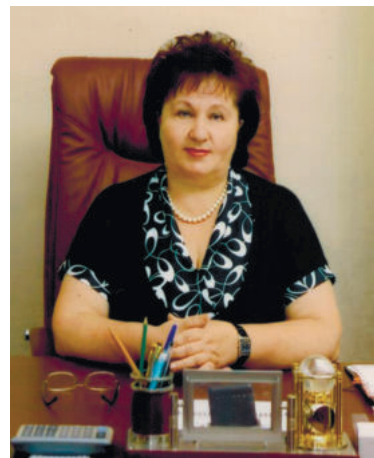
с депутатами четвертого и пятого созывов.