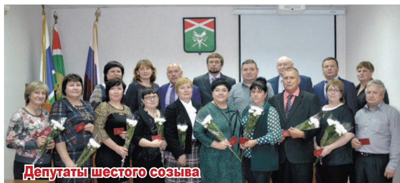
Депутаты шестого созыва

Подготовил Евгений Пашков по информации О.В. Новгородовой, заведующей организационным отделом Думы Ирбитского МО