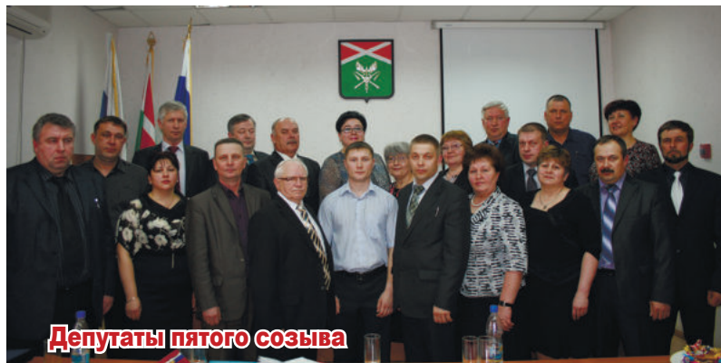
Депутаты пятого созыва

В феврале 2015 года Федеральным законом №8-ФЗ в статью 36 «Глава муниципального образования» Федерального закона 131-ФЗ внесено изменение, в соответствии с которым глава избирается представительным органом муниципалитета из числа кандидатов,