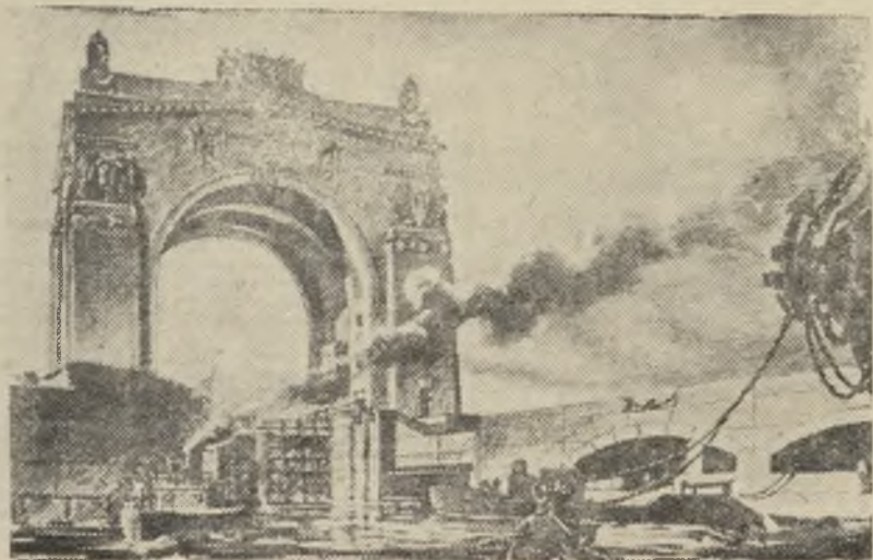
Проект архитектурного оформления Волго-Донского канала. На снимке: шлюз, через который суда, пришедшие с Волги, будут попадать в Волго-Донской судоходный канал.