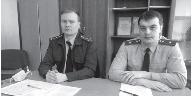
Сотрудники прокуратуры рассказали СМИ о своей работе по контролю за качеством дорог

- Также в суде рассмотрены исковые заявления по обустройству тротуаров в селе Писанец, поселке Красногвардейском и по улице Радищева в поселке Буланаш, - говорит