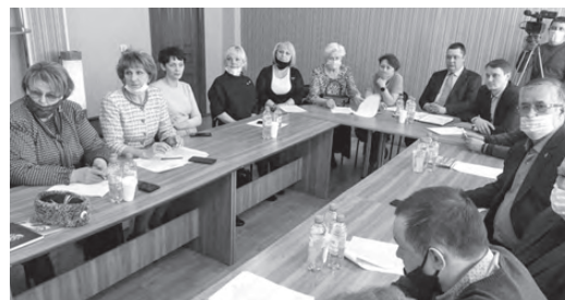
Участники встречи активно обсуждали поднятую тему.

- Есть потребность в квалифицированных кадрах, но людям нужна зарплата, а она