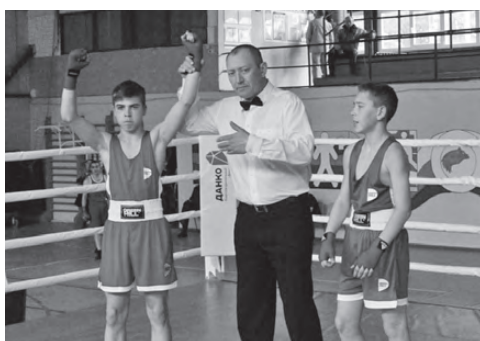
Турнир по боксу на Кубок главы АГО набирает обороты