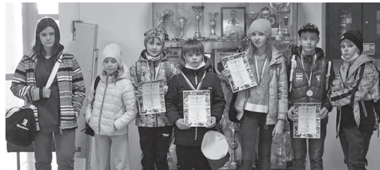
Наши пловцы показали отличные результаты

17 апреля в ФСЦ «Орион» в Верхней Синячихе состоялось первенство ДЮСШ МО Алапаевское по плаванию. Артемовцы завоевали 13 медалей.