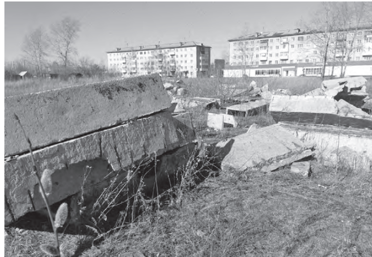
Уже много лет жители города живут рядом с железобетонной помойкой

Сначала «Облкоммунэнерго», а затем дочка компании – ОАО «ОТСК» вложили миллионы рублей в артемовскую теплотрассу. Город избавился от проблем с теплом, но в наследство после глобальных ремонтов его жителям досталась огромная свалка. Кажется, мы уже привыкли к ней и вообще смирились, что наш город «украшают»