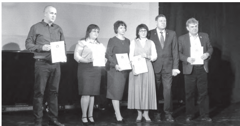
Праздник День МСУ отмечается в России с 2012 года

В среду, 21 апреля, сотрудники российских муниципальных органов отметили свой профессиональный праздник - День местного самоуправления.