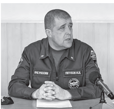
Пожары угрожают району

Вводится на территории АГО с 23 апреля. Запрещено разводить костры и сжигать мусор.