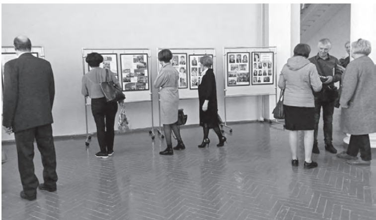
☑ В зале была организована выставка

17 апреля в Доме культуры «Угольщик» состоялась презентация книги «Школа, которой нет», посвященная истории школы №28.