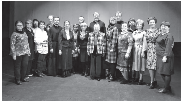
☑ Участники поездки сфотографировались с ансамблем

Конечно, по традиции, мы сделали общее фото с участниками ансамбля!