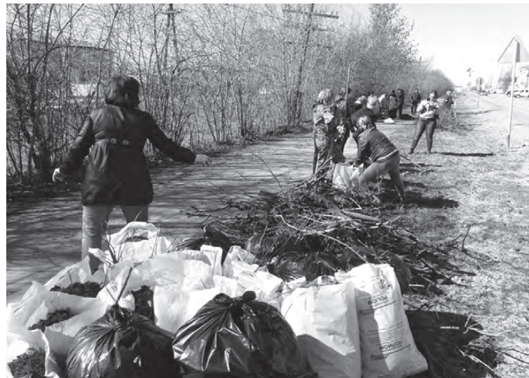
Работники артемовской администрации навели порядок на центральной улице города