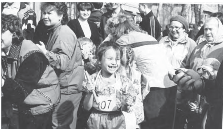
Маленькая участница большой эстафеты.

Что ж, имена тех, кто преодолел преграды на пути к победе в 68-й эстафете на призы ОАО «ДИНУР», узнаем завтра.