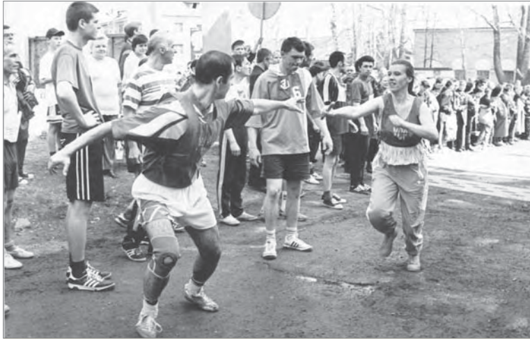
Эстафета – 2001. На дистанции – команда УСР.

В каждой команде – восемь бегущих участников и один представитель. Порядок этапов не меняется: стартуют мужчины, финишируют женщины. Общая протяжённость дистанции – 1700 метров, шесть отрез-