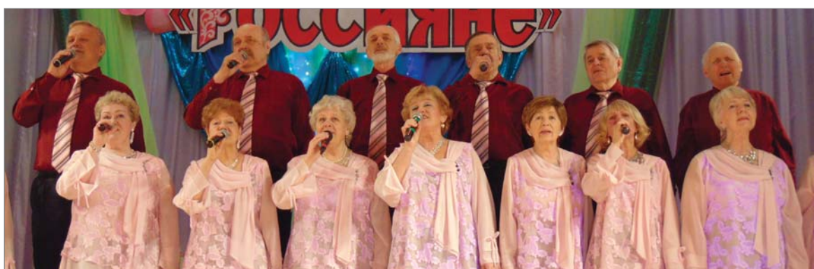
«Россияне» покоряют зрителей.