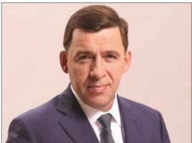
Евгений Владимирович КУЙВАШЕВ, губернатор Свердловской области

Владимир Владимирович ПУТИН, президент России. «Нам нужно создать современную среду для жизни, преобразить наши города и поселки. При этом важно, чтобы они сохранили своё лицо и историческое наследие. Обновление городской среды должно базироваться на широком внедрении передовых технологий и материалов в строительстве, современных архитектурных решений, на использовании цифровых технологий в работе социальных объектов, общественного транспорта, коммунального хозяйства».